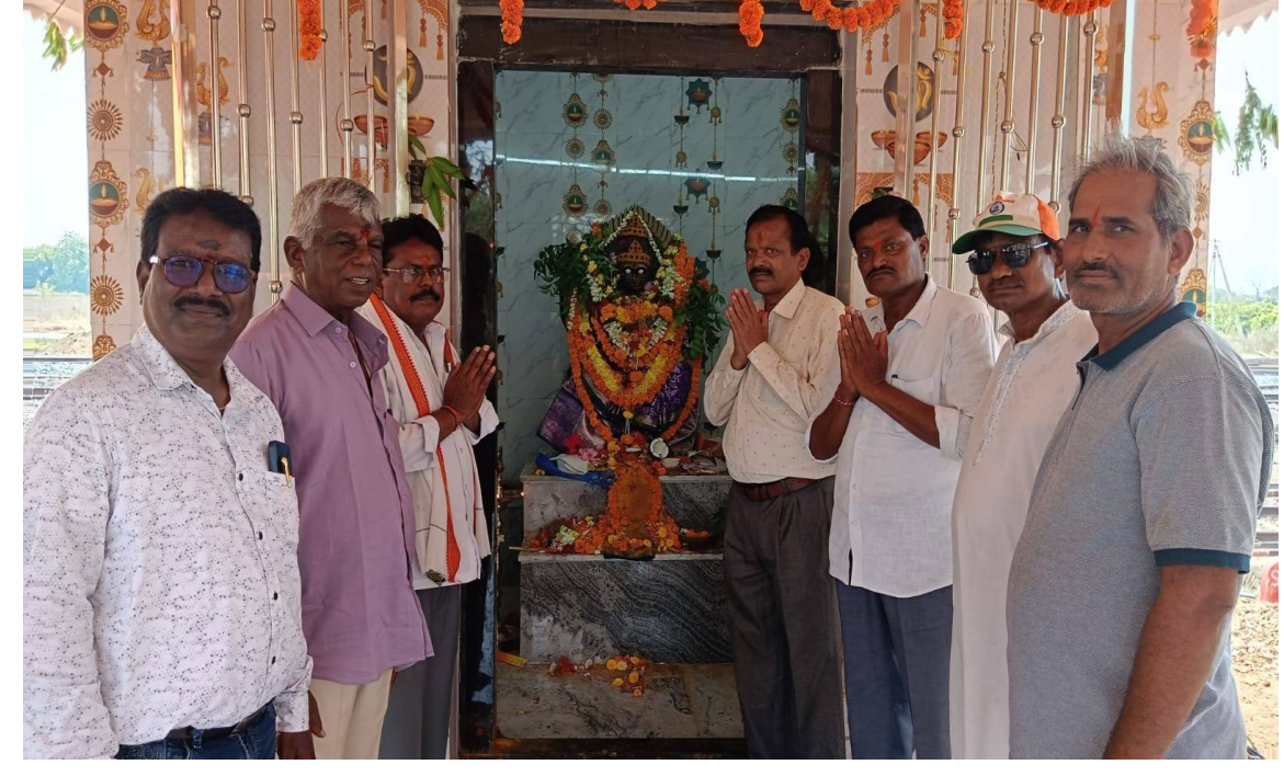
గార్ల, పెన్ పవర్, ఏప్రిల్ 11: గార్ల మండలం మర్రిగూడెం పంచాయతీలోని తిర్లాపురం గ్రామంలో శనివారం ముత్యాలమ్మ విగ్రహ పునః ప్రతిష్ఠాపన