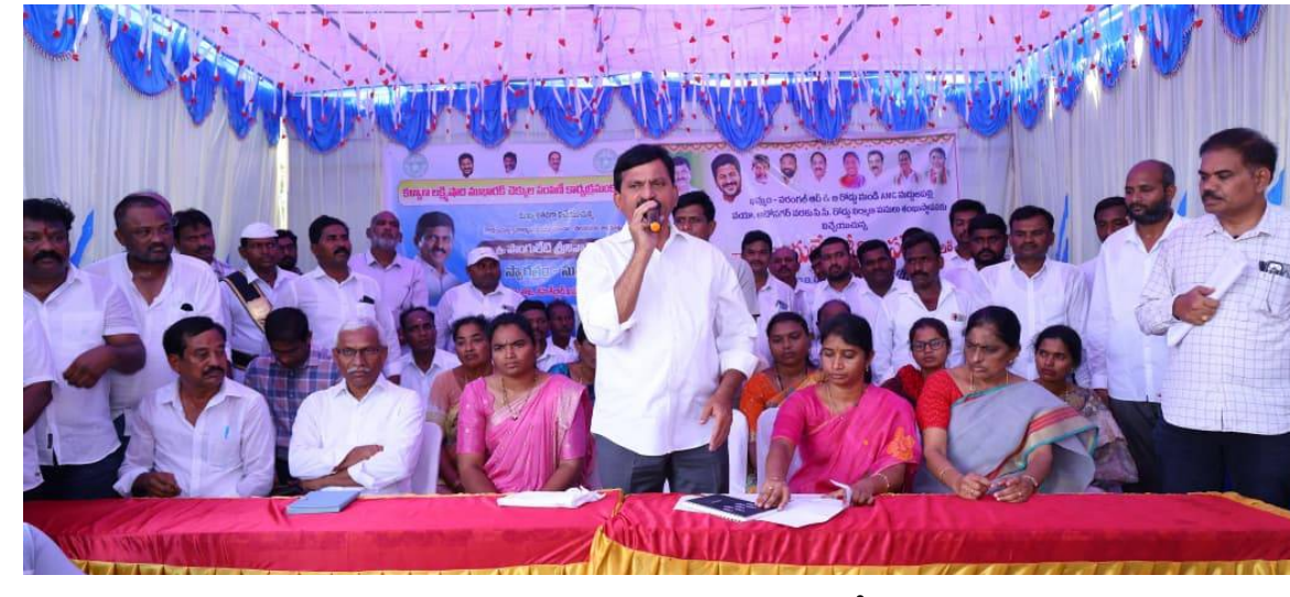
ఖమ్మం, రూరల్ పెన్ పవర్, ఏప్రిల్ 11: వరంగల్ క్రాస్ రోడ్డు ఆటోనగర్ నుంచి మద్దులపల్లి వ్యవసాయ మార్కెట్ కమిటీ వరకు రూ.4.50 కోట్లతో నిర్మించనున్న రహదారి పనులకు మంత్రి

భూమిపూజ చేశారు. ఈ సందర్భంగా ఆయన మాట్లాడుతూ.. మున్సిపాలిటీలోని 32 వార్డుల సమగ్ర అభివృద్ధి కోసం ప్రభుత్వం ఇప్పటి వరకు రూ.58.95 కోట్లు కేటాయించిందన్నారు.