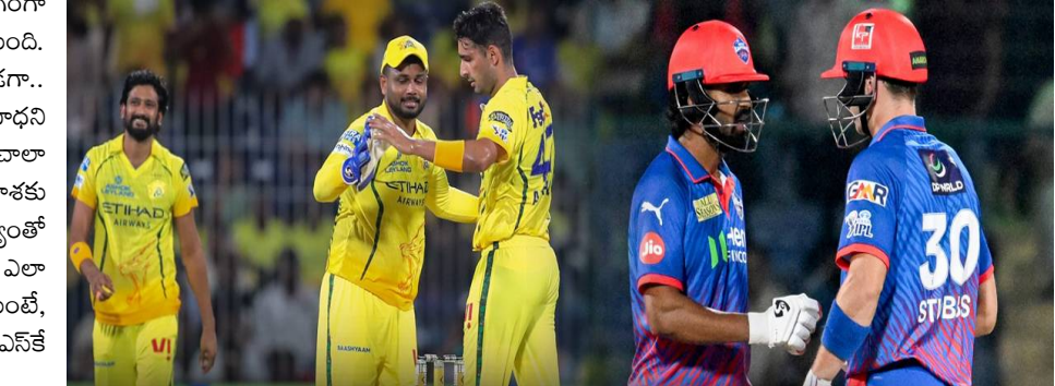
పాఠే ఛాన్స్ ఉంది. ఈ ఫ్లాట్ ట్రాక్ పై టాస్ గెలిచిన జట్టు భారీ స్కోరు సాధించాలని లక్ష్యంగా పెట్టుకుంటుంది. ఎవరు గెలుస్తారంటే? ప్రస్తుత ఫామ్ ప్రకారం ఢిల్లీ క్యాపిటల్స్ జట్టుకే విజయావకాశాలు ఎక్కువగా కనిపిస్తున్నాయి. ఆడిన మూడు మ్యాచ్ లో రెండింటిని గెలిచిన ఢిల్లీ, పాయింట్ల పట్టికలో నాలుగో స్థానంలో కొనసాగుతుంది. ఈ మ్యాచ్ గెలిచే వారు మూడో స్థానానికి వెళ్తారు. కానీ దేవాల్ బ్రెవిస్ రాకతో చెన్నై కూడా గట్టి పోటీ ఇచ్చే అవకాశం ఉంది.

హైదరాబాద్ పెన్ పవర్: ఇండియన్ ప్రీమియర్ లీగ్ (ఐపీఎల్) 2026లో భాగంగా చెన్నై సూపర్ కింగ్స్ వర్సెస్ ఢిల్లీ క్యాపిటల్స్ మధ్య ఆసక్తికరమైన పోరు జరగనుంది. ఈ మ్యాచ్ లో గెలిచి టోర్నీలో ఖాతా ఓపెన్ చేయాలని ఎల్లో ఆర్మీ చూస్తుండగా.. చెన్నై విజయం సాధించి గుజరాత్ పై ఒక్క రన్ తేడాతో ఓడిన బాధని దిగమింగుకోవాలని చూస్తుంది. దీంతో ఈ రెండు జట్లకు మ్యాచ్ గెలవడం చాలా ముఖ్యం. చెన్నై సూపర్ కింగ్స్ : ఈ సీజన్లో చెన్నై ఆటతీరు ఫ్యాన్స్ ని తీవ్ర నిరాశకు గురి చేస్తుంది. ఆడిన అన్ని మ్యాచ్ లోనూ ఓడిపోయిన సీఎస్ కె, బ్యాటింగ్ వైఫల్యంతో ఇబ్బంది పడుతోంది. ఫామ్ కోల్పోయిన సంజూ శాంసన్ ఈ మ్యాచ్ లో ఎలా రాణిస్తాడనేది ఆసక్తికరంగా మారింది. జట్టుకు ఊరటనిచ్చే విషయం ఏమిటంటే, విద్యుత్ కర బ్యాటర్ దేవాల్ బ్రెవిస్ తుది జట్టులోకి రావడం. అతని రాకతో సీఎస్ కె బ్యాటింగ్ లైన్ వ మరింత బలోపేతం కానుంది. ఢిల్లీ క్యాపిటల్స్ : అక్షర్ పఠేల్ సారథ్యంలోని ఢిల్లీ జట్టు అద్భుతమైన ఫామ్ లో ఉంది. గత మ్యాచ్ లో గుజరాత్ బ్రెవిస్ తో జరిగిన పోరులో కేవలం ఒకే ఒక్క పరుగుతో ఓడిపోయినప్పటికీ, ఆ జట్టు ఆత్మవిశ్వాసం ఏమాత్రం తగ్గలేదు. డేవిడ్ మిల్లర్ గత మ్యాచ్ లో అద్భుతంగా ఆడినప్పటికీ త్వరిత విజయాన్ని దక్కించుకోలేకపోయాడు.