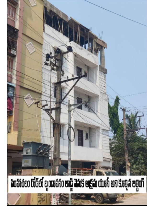
పీఐసీలు రోడ్లలో బృందావనం లాడ్జి మొక అక్రమ యూనిట్ల నిర్మాణం

పెండుర్తి జోన్ నవీవాలయం 497, 517లో రెండు యూనిట్లు మరియు పెండుర్తి పోలీస్ స్టేషన్ డౌన్లో నర్సే నెం.123/2 ప్లాన్ ఫార్మ్ ఫాలో ఉన్నప్పటికీ దీనిపై చర్యలు తీసుకోకుండా ఇష్టారాజ్యం కట్టేస్తున్నారు. అంతేకాకుండా సింహళం రోడ్డు, గొల్ల నారాయణపురం, బృందావన్ లాడ్జి మొక నిర్మిస్తున్న అక్రమ యూనిట్ నిర్మించిన మరుసటిరోజే తన సిబ్బందితో హుటాహుటలు బిల్డింగులు కూల్చి వేశారు. అదే పైన ఉదాహరించిన రెండు అనాధరెజ్డు(యూసీ)లు, ప్లాట్ ఫాలో ఉన్న బిల్డింగు కలుపుకొని 3 బిల్డింగులపై చర్యలు చర్యలు తీసుకోకుండా ఉదాసీనతో వ్యవహరించడంపై మాడు బిల్డింగుల నుంచి సుమారు రూ.20 లక్షల వరకు పనాళ్లు చేశారని, అందువలనే పేపర్లు ఎన్ని వార్తలు వచ్చిన వాటి జోలికి పోకుండా ఉదాసీనత తో వ్యవహరిస్తున్నారని, గొల్ల నారాయణపురంలో అక్రమ యూనిట్ల వేసిన వెంటనే కూల్చించిన పీఐసీ రామలింగేశ్వరరెడ్డికి ఈ బిల్డింగ్ వ్యవహారంలో ముడుపులు అందలేదనే నెవంకో కూల్చారని స్థానికులు విమర్శిస్తున్నారు. ఈ పరిణామాలు నేపథ్యంలో, పెండుర్తి, పశ్చిమ జోన్ 8 లోన్ ప్లాన్ లో వ్యవహారాలపై సమగ్ర విచారణ జరపాలనే డిమాండ్ పెరుగుతోంది. ఆరోపణలు నిజమైతే కఠిన చర్యలు తప్పవు. అదే సమయంలో, అవి నిరాధారమైతే ప్రజలకు నిజాలు తెలియజేయాలని బాధ్యత కూడా అధికారులదే. పట్టణ ప్రణాళికలో పారదర్శకత లేకపోతే, అక్రమ నిర్మాణాలు నగర భవిష్యత్తును దెబ్బతీసే ప్రమాదం ఉంది. యూసీలు ఘటనలను తేల్చేటప్పుడు సమయం ఆసన్నమైంది. నగరంలో జోన్స్ విభజన తర్వాత అక్రమంగా యూసీ నిర్మాణాలు పెరిగిపోతున్నాయని