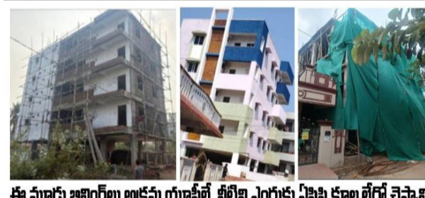
ఈ మాడు ఇల్లు అక్రమ యూనిట్. పీఐసీ ఎండుకు పీఐసీ కలెక్టర్లతో చెప్పాలి