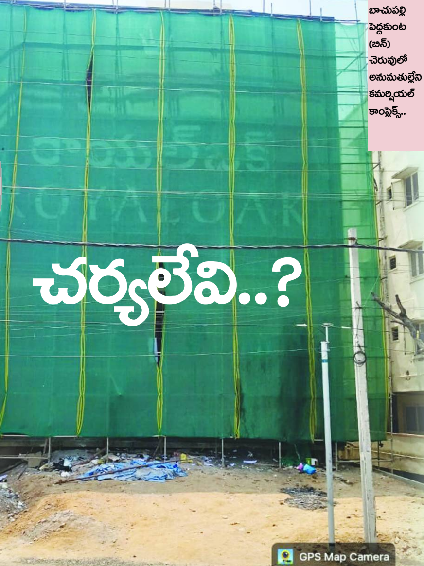
బాచుపల్లి పెద్దకుంట (బిన్) చెరువులో అనుమతుల్లేని కమర్షియల్ కాంప్లెక్స్..