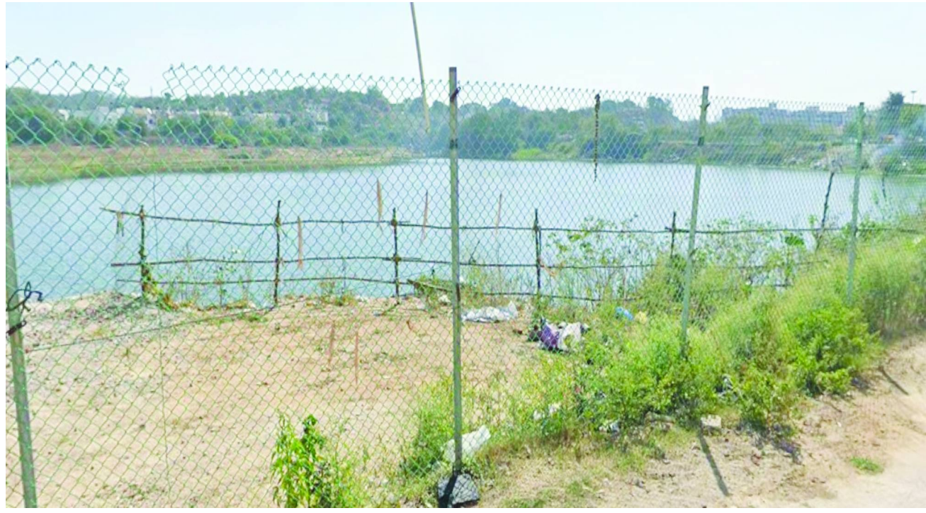
బాచుపల్లి పెద్దకుంట (బిన్ చెరువు) లోకెబడి నెం.2821 చెరువు.