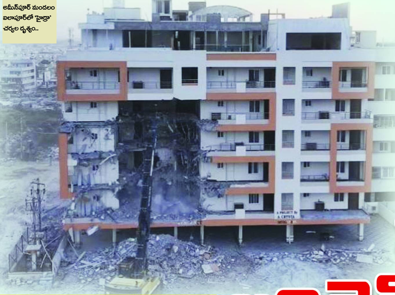
అమీన్ పూర్ మండలం బలాపూర్లో 'హైద్రా' చర్యల దృశ్యం..