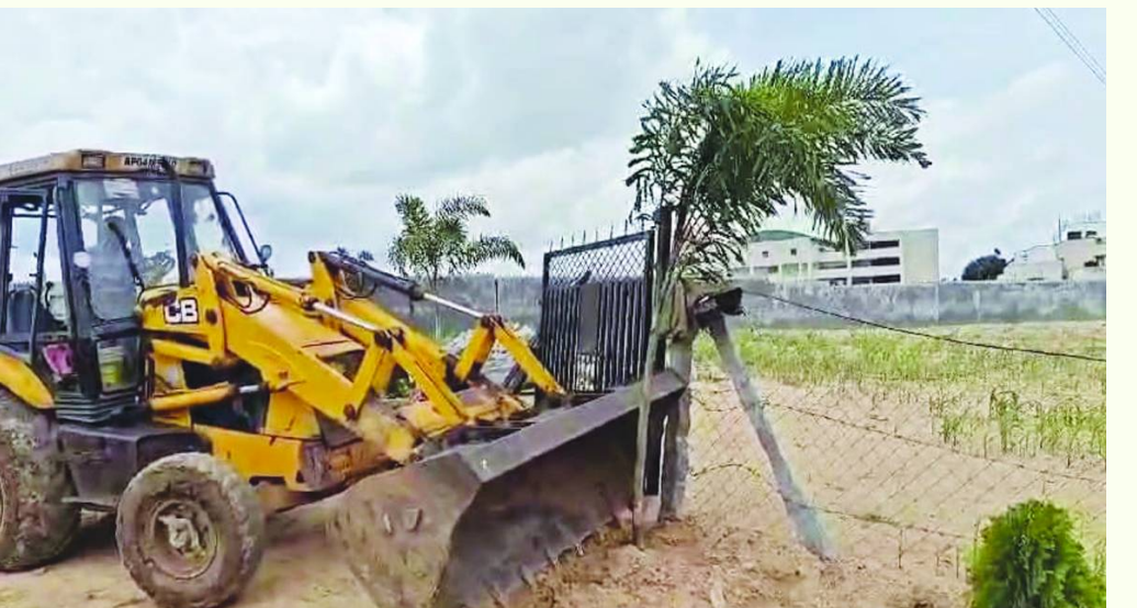
అదనపు కలెక్టర్ ఆదేశాలతో 2024 ఆగస్టు 7న రెవెన్యూ కూల్చివేతలు.. ఫైల్ ఫోటో..