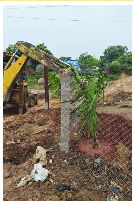
2024 జూలై 7న రెవెన్యూ కూల్చివేతలు.. ఫైల్ ఫోటో..