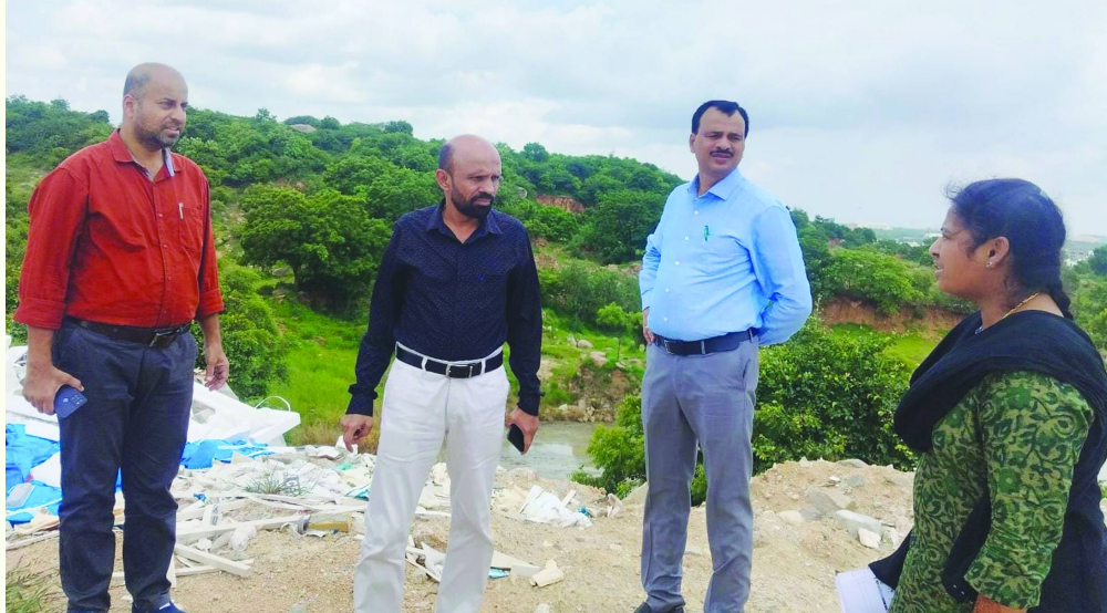
2024 జూలై 31న బొరంపేట్ లోని పలు ప్రభుత్వ భూములు పరిశీలిస్తున్న అదనపు కలెక్టర్, ఆర్డీవో, తహశీల్దార్, సర్వేయర్.. ఫైల్ ఫోటో..