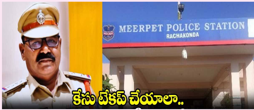
కేసు టేకప్ చేయాలా..