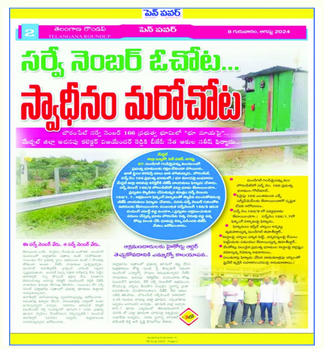
20 నెలల క్రితం ఇదే భూవివాదంపై పెన్ పవర్ దినపత్రికలో కథనాలు..