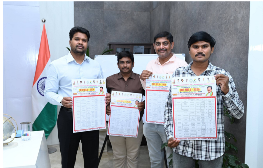
అమలాపురం/అంబాజీపేట, పెన్ పవర్, ఏప్రిల్ 15:డా. బి.ఆర్. అంబేద్కర్ కోనసీమ జిల్లా యువతకు ఉపాధి అవకాశాలను విస్తృతంగా కల్పించే దిశగా జిల్లా పరిపాలన కీలక చర్యలు చేపడుతోంది. ఆంధ్రప్రదేశ్ రాష్ట్ర వైపుజ్యోతివృద్ధి సంస్థ, మరియు వికాస సంస్థల సంయుక్త ఆధ్వర్యంలో ఈ నెల 18వ తేదీ న అమలాపురంలోని శ్రీ వెంకటేశ్వర డిగ్రీ కళాశాల, భూపయ్య అగ్రహారం ప్రాంగణంలో భారీ జాబ్ మేళాను నిర్వహించనున్నట్లు జిల్లా కలెక్టర్ తెలిపారు. ఈ జాబ్ మేళాకు సంబంధించిన గోడపత్రికను జిల్లా కలెక్టర్ ఆవిష్కరించారు. ఈ సందర్భంగా ఆయన మాట్లాడుతూ, జిల్లాలోని యువత యువకులు ప్రభుత్వంతో పాటు ప్రైవేట్ రంగం అందిస్తున్న ఉపాధి అవకాశాలను సద్వినియోగం చేసుకొని స్వయం సమృద్ధి సాధించాలని విజ్ఞప్తిచేశారు. విద్య పూర్తయ్యాక నిరుద్యోగంగా ఉండకుండా, తమ