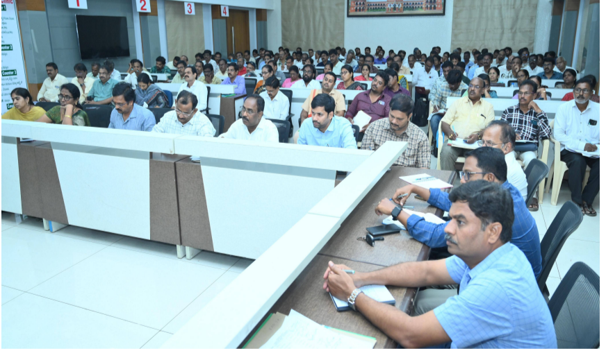
ఎంపీకే చేయాలని, వెంటనే మండలాల్లో జల సంరక్షణ పనులు, డెల్టా ప్రాంతాల్లో ముంపు నివారణ, నీటి సరఫరా పనులను చేపట్టాలని తెలిపారు. 90 రోజుల్లో ఈ పనులను ఉద్యమ స్థాయిలో నిర్వహించి భూగర్భ జలాలను పెంచాలని ఆకాంక్షించారు. ఉపాధి హామీ పథకం కింద ఏప్రిల్ నెలలో లక్షా 20 వేల పనిదినాల లక్ష్యాన్ని వచ్చే 15 రోజుల్లో పూర్తి చేయాలని ఆదేశించారు. జిల్లాలో చేపట్టిన 380 ఫ్యామ్ పాండ్ల పనులను వర్షాకాలానికి ముందే పూర్తి చేయాలని సూచించారు. గోకులం షెడ్యూ, ఎవెన్యూ, హార్టికల్చర్ ప్రాజెక్ట్ల వనరుల వేగవంతం చేయాలని తెలిపారు. పంచాయతీల్లో ఇంటింటి చెత్త సేకరణను సమర్థ వంతంగా నిర్వహించి, చెత్త నుండి సంపద కేంద్రాలను వినియోగంలోకి తీసుకురావాలని, రాజోయే మూడు నెలల్లో పారిశుధ్యంలో నృష్టమైన మార్పు కనిపించేలా చర్యలు తీసుకోవాలని పేర్కొన్నారు. పర్యటనకుముందే డ్రైయింగ్ డిసిల్వింగ్ పూర్తి చేయాలని