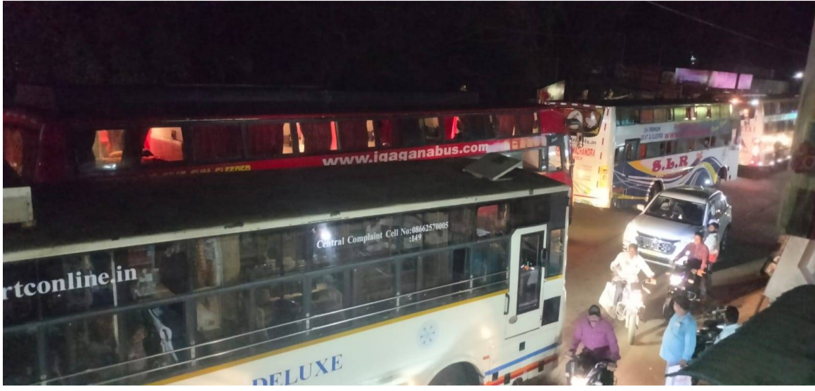
తొలగుతాయని . ఆదికగా అటు సంబంధిత అధికారులు, పోలీసు అధికారులు దృష్టి చారించాలని ప్రజలు కోరుకుంటున్నారు.

అంబాజీపేట, పెన్ పవర్, ఏప్రిల్ 15: స్థానిక బస్టాండ్ వద్ద ప్రయివేట్ బస్సులు నిలుపుదల చేయడంతో నిత్యం ట్రాఫిక్ సమస్యలతో వాహనదారులు, ప్రయాణికులు అనేక ఇబ్బందులు ఎదుర్కొంటున్నారు. తెంగాణ రాష్ట్రం హైదరాబాద్ వెళ్ళే బస్సులు అమలాపురం నుండి నిత్యం అధిక సంఖ్యలో అంబాజీపేట మీదుగా వెళుతున్నాయి. అన్ని ట్రావెల్ కంపెనీలకు చెందిన బస్సులు ఒకేసారి అంబాజీపేట చేరుకోవడంతో బస్టాండ్ వద్ద ప్రతీరోజూ ట్రాఫిక్ సమస్యలు ఏర్పడుతున్నాయి. ప్రయివేటు వాహనాల టిక్కెట్ విక్రయదారులు బస్టాండ్ ఎదురుగా నిలవడంతో ఒకేసారి అడ్డంకి కు చెందిన బస్సులు, ప్రయివేటు ట్రావెల్స్ బస్సులు అన్ని రైలు పెట్టెలు గా పొడవుగా నిలవడంతో చాలా ఇబ్బందులు ఎదురవుతున్నాయి. బస్టాండు కు సమీపంలో మధ్యంపాపు, సమీపంలో కాఫీ హోటల్ ఉండడంతో సాయంత్రం సమయంలో ఈ ప్రాంతంలో అధిక ట్రాఫిక్ అధికంగా ఉంటుంది. ప్రయివేటు ట్రావెల్స్ బస్సు లను బస్టాండ్ కు కూతవేటు దూరంలో నిలువదల చేస్తే ట్రాఫిక్ సమస్యలు లేకుండా వాహనదారులు, ప్రయాణికులు ఇబ్బందులు