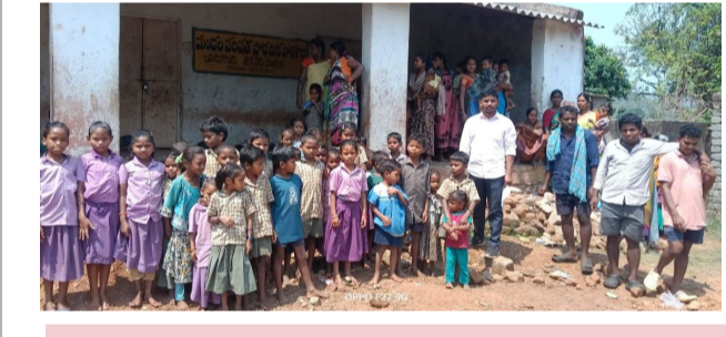
10 ఏళ్లగా అంగన్వాడీ కోసం ఎదురు చూపులు శిథిలావస్థలో పాఠశాల భవనం.. విల్లల భద్రతల్ల అందోళన