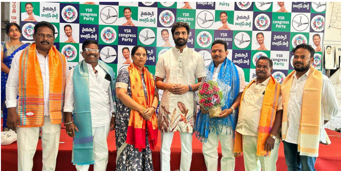
ఇచ్చారు. పార్టీ కోసం కష్టపడి పనిచేసే ప్రతి కార్యకర్తకు గుర్తింపు రాసున్న కార్పొరేషన్ ఎన్నికలలో పార్టీ విజయమే లక్ష్యంగా ముందుకు సాగరామని పిలుపు నిచ్చారు.