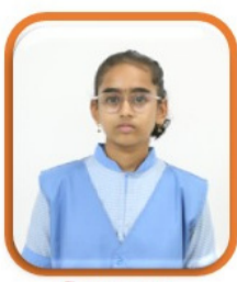
G Vernica 474/500