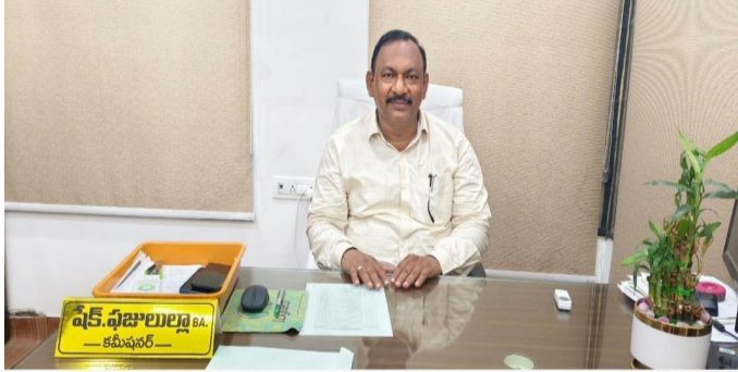
కావాలని అధికారులు కోరుతున్నారు.

నాయుడు పేట, పెన్ పవర్, ఏప్రిల్ 16 నాయుడుపేట పురపాలక సంఘం పరిధిలోని పుదుూరు ఎస్టిఆర్ నగర్లో ప్రధానమంత్రి ఆవాస్ యోజన కింద నిర్మించిన టిడో ఇళ్లు ఎట్టకేలకు గృహప్రవేశాలకు సిద్ధమయ్యాయి. అన్ని హంగులతో నిర్మాణం పూర్తయిన ఈ ఇళ్లలోకి లబ్ధిదారులు త్వరలోనే ప్రవేశించవచ్చని అధికారులు వెల్లడించారు. ప్రస్తుతం ఎస్టిఆర్ నగర్ లో అప్పట్లోని ౧౫17, ౧౫18 సింగిల్ బెడ్ రూమ్ జ3, జ4 ౪ డబుల్ బెడ్ రూమ్ బ్లాకు లు గృహప్రవేశానికి పూర్తిస్థాయిలో సిద్ధంగా ఉన్నాయని పురపాలక అధికారులు స్పష్టం చేశారు. ఈ బ్లాకుల్లోని లబ్ధిదారులు తక్షణమే తమ ఇళ్లకు విద్యుత్ సదుపాయం కల్పించుకోవాలని మున్సిపల్ కమిషనర్ సూచించారు. కరెంటు మీటర్ కోసం నిర్దీత రుసుము రూ.500 చెల్లించి వెంటనే దరఖాస్తు చేసుకోవాలని కోరారు. ఎలక్ట్రిసిటీ కనెక్షన్ ఏర్పాటు చేసుకున్న వెంటనే లబ్ధిదారులు తమ ఇళ్లలో చేరవచ్చని తెలిపారు. విద్యుత్ దరఖాస్తు ప్రక్రియలో జాప్యం చేయకుండా లబ్ధిదారులు త్వరితగతిన స్పందించి, గృహప్రవేశాలకు సిద్ధం