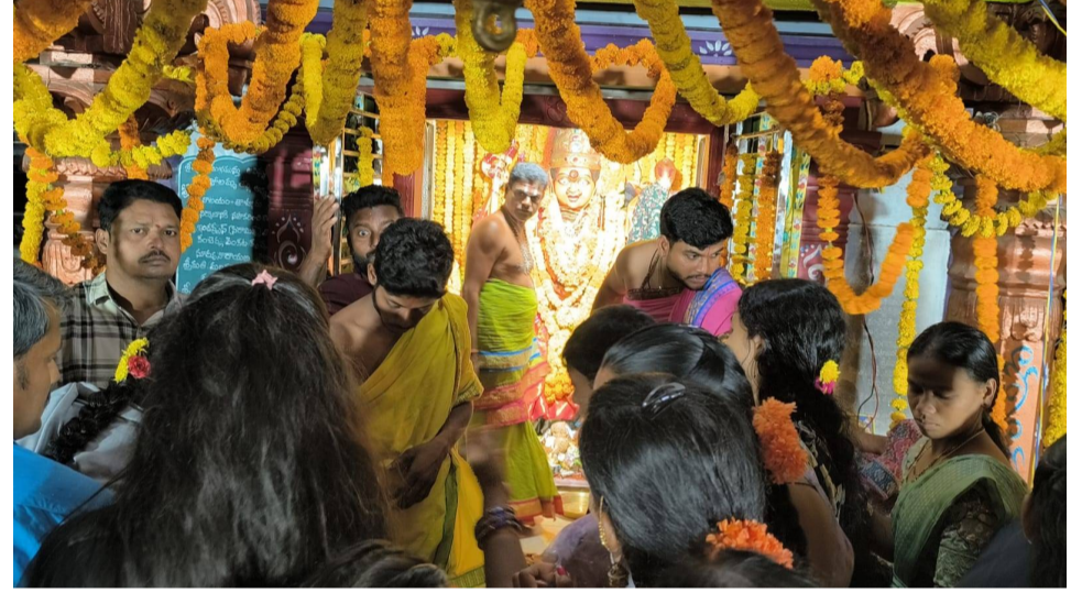
ఘనంగా పోలవూ తల్లి జాతర