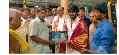
కొత్తపేట, పెన్ పవర్, ఏప్రిల్ 21: కొత్తపేట మండలం మందపల్లి శ్రీ శనీశ్వర స్వామి ఆలయాన్ని మంగళవారం ప్రముఖ టీవీ ఆర్టిస్ట్, జబర్దస్ట్ టీం నభ్యుడు సుడిగాలి సుదీర్ దర్శించుకున్నారు. ఈ సందర్భంగా ఆలయ వేద

పండితులు ఆయనకు వేద అశీర్వాదాలు అందించారు. స్వామివారిని భక్తి శ్రద్ధలతో దర్శించిన సుదీర్ భక్తి పరవశం చెందారు. ఆలయంలో నిర్వహణ, అభివృద్ధి పనులపై ఆయన సంతోషం వ్యక్తం చేశారు. అనంతరం మాట్లాడుతూ మందపల్లి మందిశ్వర స్వామిని ఎప్పుడైనా దర్శించుకోవచ్చని తెలిపారు. ప్రతి శివాలయం లోగ్ ఈ ఆలయంలో కూడా భక్తులకు ఎలాంటి అడ్డంకులు లేకుండా దర్శన సౌకర్యం కల్పిస్తున్నట్లు పేర్కొన్నారు. ఈ సందర్భంగా ఆలయ సిబ్బంది, స్థానిక భక్తులు పాల్గొన్నారు.