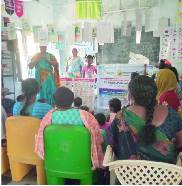
గుడ్లూరు, పెన్ పవర్, ఏప్రిల్ 21