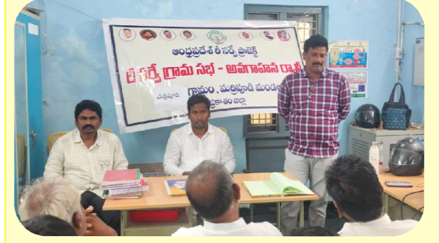
పొదిలి, పెన్ పవర్, ఏప్రిల్ 21