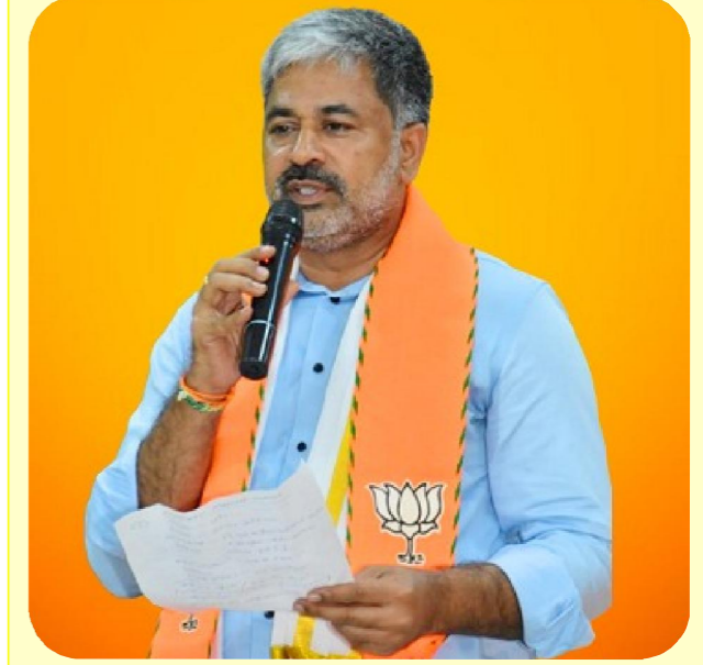
మార్కాపురం పెన్ పవర్ ఏప్రిల్ 21

బిజెపి రాష్ట్ర మీడియా ప్రతినిధి డాక్టర్ ఏలూరి డిమాండ్