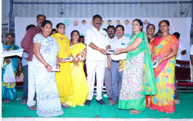
మార్కాపురం రూరల్ పెన్ పవర్ 21