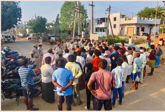
వలేటివారిపాలెం, పెన్ పవర్ ఏప్రిల్ 21

కార్డన్ అండ్ సెర్చ్ లో 34 మోటార్ సైకిల్, ఒక ఆటో మరియు ఒక కారు స్వాధీనం