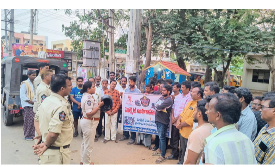
కిర్రంపూడి/ప్రత్తిపాడు, పెన్ పవర్, ఏప్రిల్ 23: రోడ్డు ప్రమాదాలను నివారించడంలో హెల్మెట్ వినియోగం కీలక పాత్ర