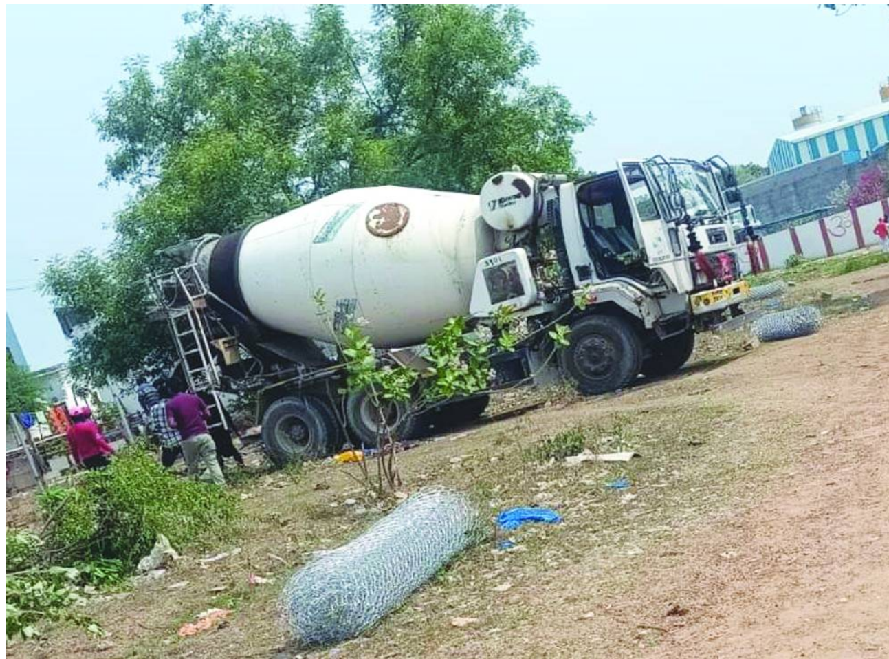
ఫెన్సింగ్ పోలీసు సెంటర్ కాంట్రీట్ వాహనం.