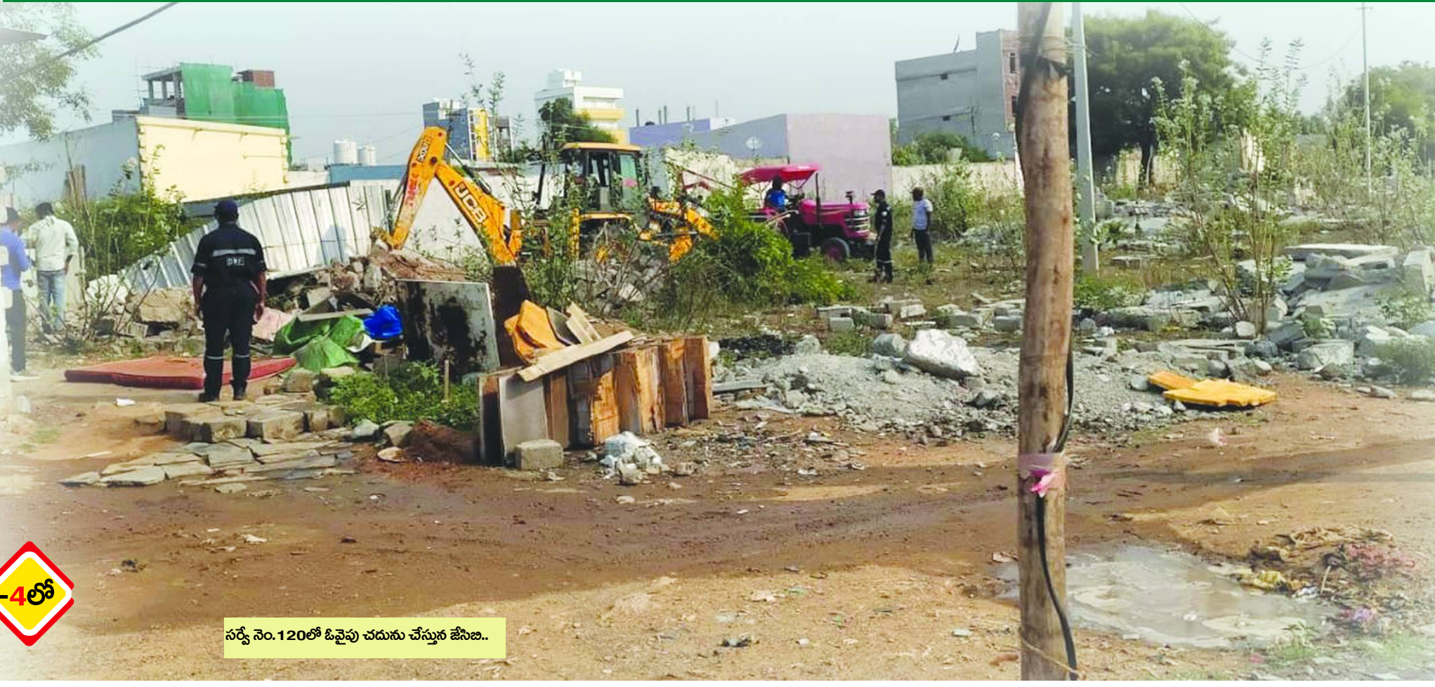
సర్వే నెం.120లో ఓవైపు చదును చేస్తున్న జేసీబి..