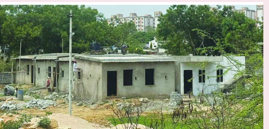
సర్వే నెం.120 గైరాన్ సర్కార్ భూమిలో అక్రమంగా నిర్మించిన అక్రమ నిర్మాణాలు..