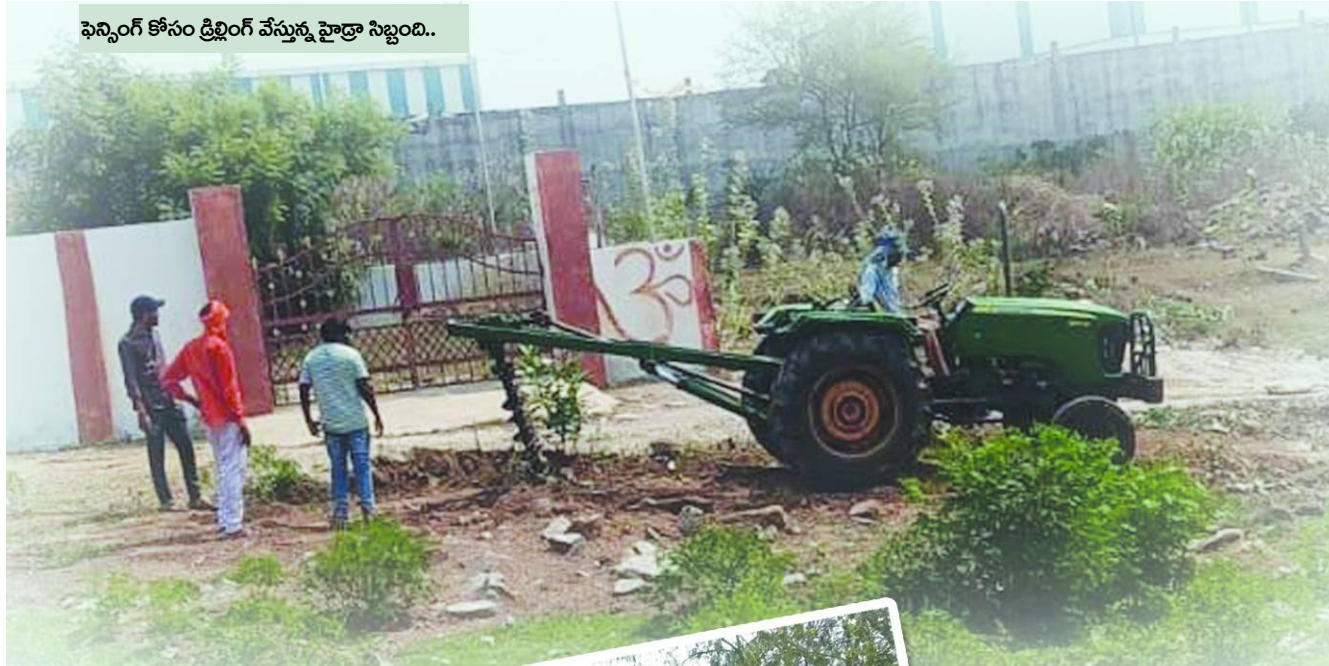
ఫెన్సింగ్ కోసం డ్రిలింగ్ వేస్తున్న హైద్రా సిబ్బంది..