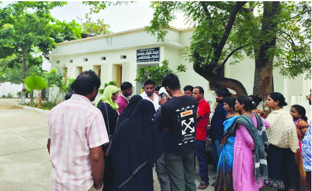
దుండిగల్ తహసీల్దార్ కార్యాలయం ముందు బాధితులు.

చేయాలని అభ్యర్థించారు. భూమిని రక్షించడానికి తగిన చర్యలు తీసుకోవాలని హైద్రాకు తహసీల్దార్ రాసిన లేఖతో గురువారం సుమారు రూ.80 కోట్లు విలువైన ప్రభుత్వ భూమిని హైద్రా కాపాడింది..