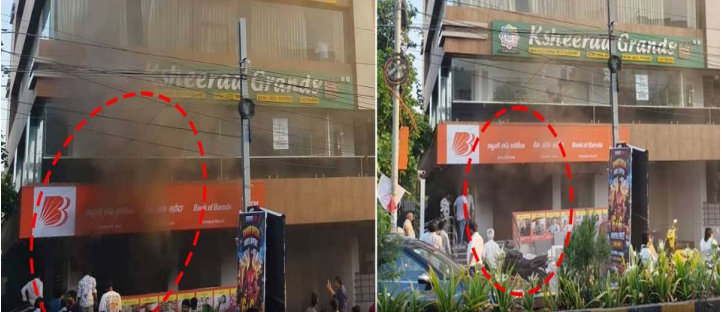
ఫైర్ సిబ్బంది ఘటనాస్థలానికి చేరుకొని మంటలను అదుపులోకి తెచ్చారు. ఈ ఘటనలో ప్రాణనష్టమేమీ జరగకపోవడంతో అంతా ఊపిరి పీల్చుకున్నారు.

హైదరాబాద్ పెన్ పవర్: హైదరాబాద్ లోని నిజాంపేట్ లో అగ్నిప్రమాదం చోటు చేసుకుంది. శనివారం (మే 9) జరిగిన ఈ ఘటనకు సంబంధించి వివరాలిలా ఉన్నాయి.. నిజాంపేట్ లోని హై బిస్నెస్ లైన్ రోడ్ లో ఉన్న బ్యాంక్ ఆఫ్ బరోడా బ్రాంచ్ లో అగ్నిప్రమాదం చోటు చేసుకుంది. బ్యాంక్ లో ఒక్కసారిగా మంటలు చెలరేగడంతో దట్టమైన పొగ కమ్ముకుంది. రెండో శనివారం కావడంతో బ్యాంకు సెలవు కాబట్టి పెను ప్రమాదమే తప్పిందని చెప్పాలి. ప్రమాదానికి గల కారణాలు తెలియాల్సి ఉంది. ఘటనపై ఫైర్ సిబ్బందికి సమాచారం అందించారు స్థానికులు. సమాచారం అందుకున్న