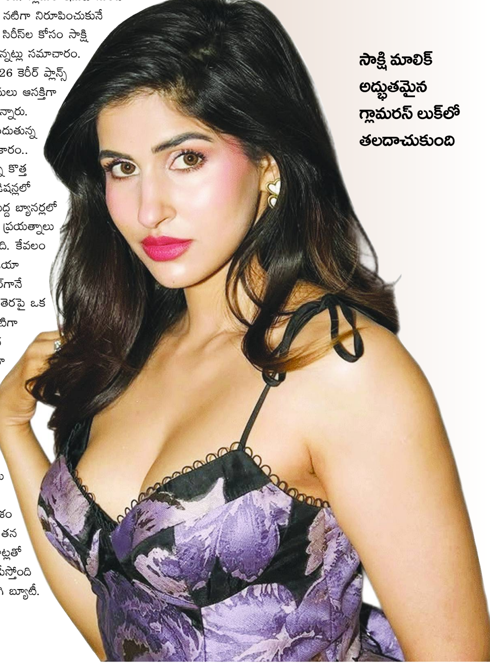
సాక్షి మాలిక్ అద్భుతమైన గ్లామరస్ లుక్లో తలదాచుకుంది