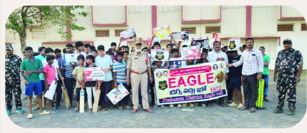
క్రైమ్ రిపోర్టర్ పెన్ పవర్, ఒంగోలు మే 11