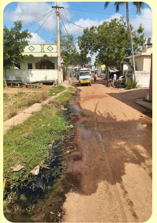
వలేటివారిపాలెం, పెన్ పవర్ మే 11

మండలంలోని శామీర్ పాలెం గ్రామంలో రామాలయం వద్ద మురుగు నీరు రోడ్డుపై గలగలా గోదారి వలే పారుతుంది. సైడ్ కాలువలు చెత్తాచెదారం తో పేరుకు పోవడంతో మురుగు నీరు ముందుకు వెళ్ళడం లేదు. కాబట్టే నుంచి మురుగు నీరు రోడ్డు మీదకు చేరి కంపుకొడుతుంది. సచివాలయం సిబ్బంది నిత్యం ఈ రోడ్డుపైనే తిరుగుతున్నారు, సమస్య కళ్ళముందే కనబడుతున్న పట్టించుకోవడంలేదని ప్రజలు ఆవేదన వ్యక్తం చేస్తున్నారు. రోడ్డు మీద నీరు నిలిచి పాచి పట్టింది. ద్విచక్ర వాహనదారులు జారి కింద పుడుతున్నారు. సమస్యను అధికారులు దృష్టికి తీసుకెళ్లినప్పటికీ పట్టించుకోవడంలేదని అంటున్నారు. ఇప్పటికైనా పంచాయతీ అధికారులు స్పందించి మురుగు నీరు తొలగించి ప్రమాదాలు జరగకుండా చర్యలు తీసుకోవాలని గ్రామస్థులు కోరుతున్నారు.