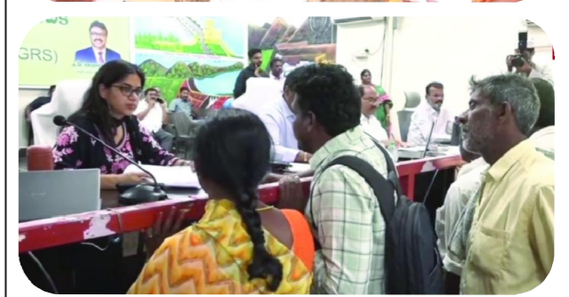
బ్యారో పెన్ పవర్, ప్రకాశం మే 11