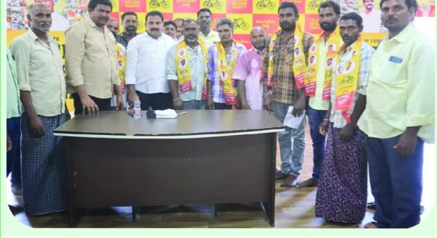
కందుకూరు పెన్ పవర్ మే 11