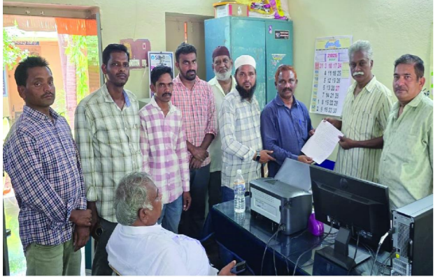
దొనకొండ మే 11 పెన్ పవర్ :