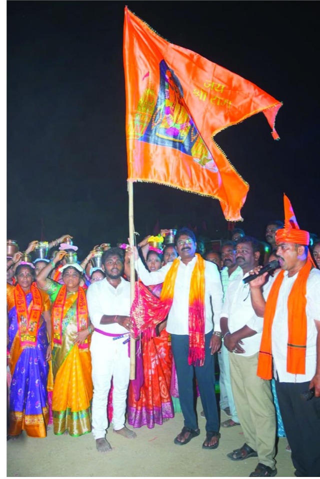
గద్దలూరు పెన్ పవర్ మే 11

గద్దలూరు పట్టణంలో హనుమాన్ జయంతిని పురస్కరించుకుని సోమవారం సాయంత్రం హనుమాన్ శోభాయాత్రను అంగరంగ వైభవంగా నిర్వహించారు. ఈశోభాయాత్ర ను గద్దలూరు శాసనసభ భర్తలు