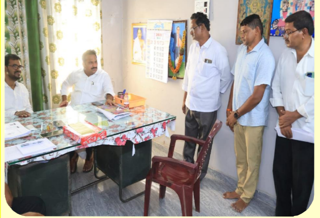
వలేటివారిపాలెం, మే 11 పెన్ పవర్

స్థానిక వలేటివారిపాలెం తహసీల్దార్ కార్యాలయాన్ని కందుకూరు ఎమ్మెల్యే ఇంటూరి నాగేశ్వరరావు సోమవారం సాయంత్రం ఆకస్మికంగా తనిఖీ చేశారు. గ్రీవెస్ట్ లో వచ్చిన అర్జీలు, వాటిలో ఎన్ని పరిష్కరించారు, పెండింగ్ లో ఎన్ని ఉన్నాయి అనే అంశాలపై దృష్టి పెట్టారు. అర్జీలను వీలైనంత త్వరగా పరిష్కరించాలని తహసీల్దార్ మధుసూదన్ రావును ఆదేశించారు. కొంతమంది వీఆర్సీలు విధుల్లో నిర్లక్ష్యంగా ఉంటున్నట్లు, అర్జీదారులను పడేపడే తిప్పుకుంటున్నట్లు తన దృష్టికి వచ్చిందని ఎమ్మెల్యే ఆగ్రహం వ్యక్తం చేశారు. అలాంటివారు వెంటనే తమ పద్ధతి మార్చుకోవాలని హెచ్చరించారు. రెవిన్యూ సమస్యల పట్ల, బాధ్యతగా వ్యవహరించి పనిచేయాలని ఎమ్మెల్యే నాగేశ్వరరావు సూచించారు.