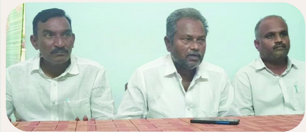
కందుకూరు పెన్ పవర్, మే 11