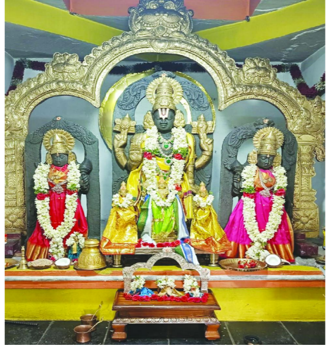
సి ఎస్ పురం, పెన్ పవర్ మే 11