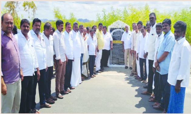
సి ఎస్ పురం, పెన్ పవర్ మే 11

పుణ్యక్షేత్రాల అభివృద్ధికి ప్రభుత్వం ప్రాధాన్యత -కార్యక్రమాలలో పాల్గొన్న టిడిపి నాయకులు