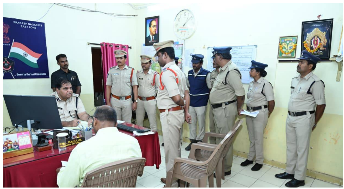
విధానాన్ని పరిశీలించి, నేర నియంత్రణలో సీనిటీవీ వ్యవస్థను వినియోగించాలని ఆదేశించారు. పోలీసు కానిస్టేబుళ్ల కంప్యూటర్ పరిజ్ఞానం, స్మార్ట్ ఫోన్లపై విధానాలపై అవగాహన కలిగి ఉండేలా శిక్షణ ఇవ్వాలని అధికారులకు సూచించారు.