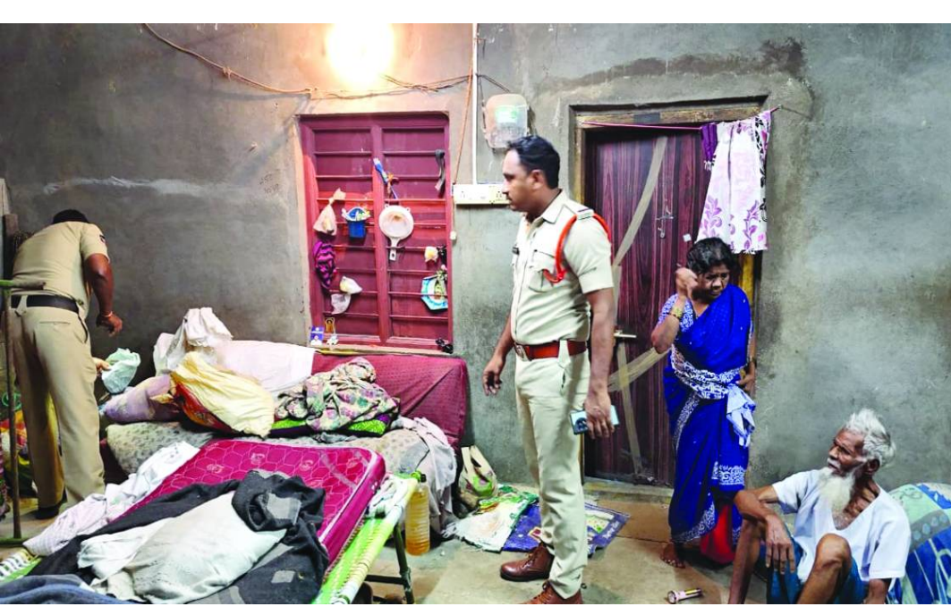
రికార్డులు లేకుండా తిరుగుతున్న వాహనాలపై పోలీసులు ఉక్కుపాదం మోపారు. ఆయా ప్రాంతాలలో అనుమానాస్పదంగా ఉన్న మొత్తం 133 వాహనాలను నిలిపివేసి క్షుణ్ణంగా తనిఖీ చేయగా.. పక్కా ఆధారాలు లేని 78 వాహనాలను స్పాట్లోనే స్వాధీనం చేసుకుని పోలీస్ స్టేషన్లకు తరలించారు. ఇందులో 71 దివ్యచక్ర వాహనాలు, 4 ఆటోలు, 2 కార్లు మరియు ఒక ట్రాక్టర్ ఉన్నాయి. చట్టపరమైన పూర్తి పత్రాలు సమర్పించిన తర్వాత ఈ వాహనాలను విడుదల చేయడం జరుగుతుందని, నిబంధనలు అతిక్రమిస్తే కఠిన చర్యలు తప్పవని స్పష్టం చేశారు. అయితే పోలీస్ శాఖ అంటే కేవలం తనిఖీలు, కేసులు మాత్రమే కాదు.. ప్రజలతో మమేకమయ్యే రక్షకులు అని నిరూపిస్తూ, తనిఖీల అనంతరం మదనపల్లెలో 300 మంది, కలకడలో 210 మంది ప్రజలను ఒకచోటకు చేర్చి ముఖాముఖీ సమావేశాలు నిర్వహించారు. స్థానిక శాంతిభద్రతల సమస్యలను నేరుగా ఆడిగి తెలుసుకున్నారు. “మా ప్రాంతాల రక్షణే మా బాధ్యత. ఊళ్లోకి కొత్త వ్యక్తులు వచ్చినా, లేదా

ఎవరైనా అనుమానాస్పదంగా తిరుగుతున్నట్లు గమనించినా భయపడకుండా వెంటనే పోలీసులకు సమాచారం అందించండి” అని స్థానికుల్లో ధైర్యాన్ని నింపారు. అనంతరం సమాజ శ్రేయస్సు కోసం, నేరాల నిర్మూలన కోసం ప్రజలందరితో కలిసి పోలీసులు, ఈగల్ డివీజన్ సిబ్బంది “ఆపరేషన్ వజ్రప్రహారీ ప్రతిజ్ఞ” చేయించారు. ప్రజలు, పోలీసులు కలిసికట్టుగా నిలబడిన ఆ క్షణం ఈ ఆపరేషన్ కే తొలగించడమేనని. ఈ సందర్భంగా డివిజన్ లు గట్టి హెచ్చరికలు జారీ చేశారు. ఇకపై జిల్లాలో గంజాయి రవాణా చేసినా, విక్రయించినా పాత నేరస్థులైనా, కొత్త వారైనా సరే.. పీడీ యాక్ట్, బి.ఐ.టి, ఎన్డీపీఎస్ చట్టాల కింద అత్యంత కఠినమైన జైలు శిక్షలు తప్పవని స్పష్టం చేశారు.