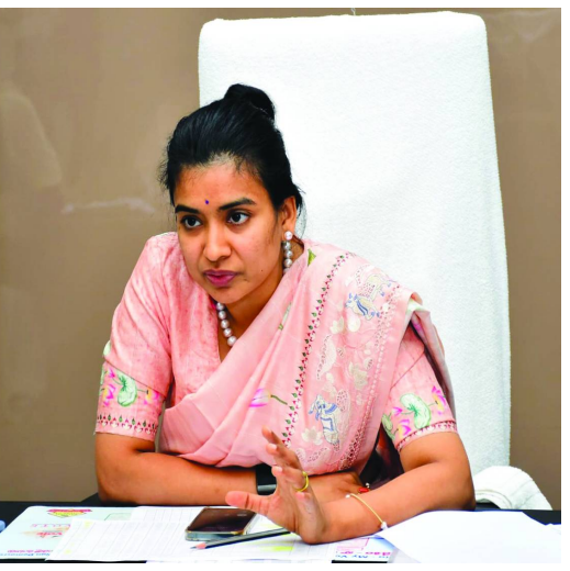
సజావుగా పూర్తయ్యేలా చూడాలని కలెక్టర్ ఆదేశించారు. కొనుగోలు కేంద్రాల నుండి తూకం వేసిన ధాన్యం బస్తాలను తరలించేందుకు సరిపడా వాహనాలు అందుబాటులో ఉండేలా చూడాలని, వాహనాలు సమకూర్చకపోతే సంబంధిత కాంట్రాక్టర్లపై చర్యలు తీసుకోవాలని ఆదేశించారు. కొనుగోలు