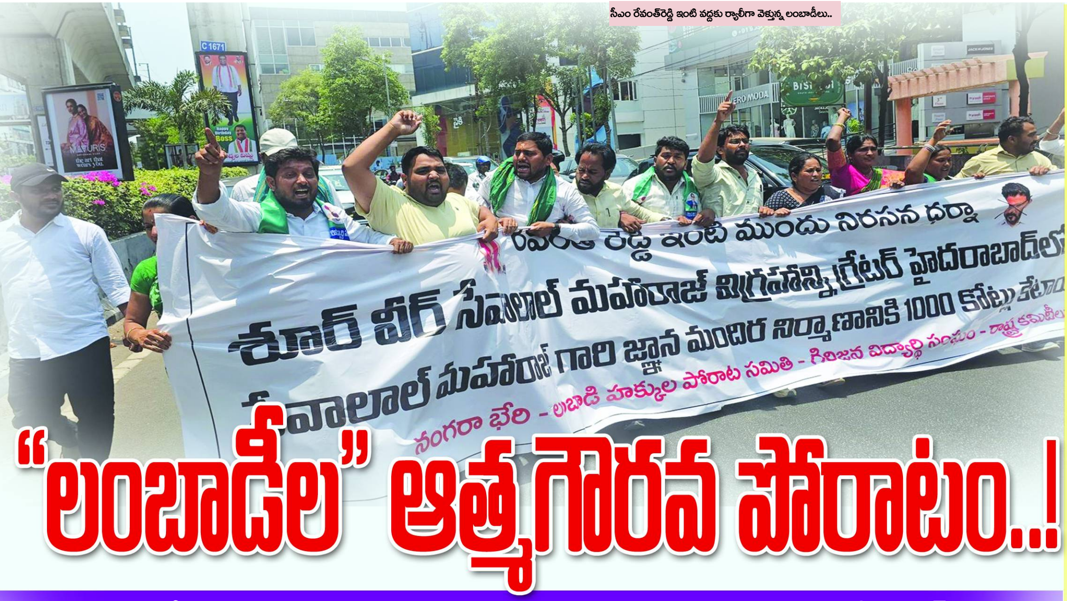
సీఎం రేవంత్ రెడ్డి ఇంటి వద్దకు ర్యాలీగా వెళ్తున్న లంబాడీలు..