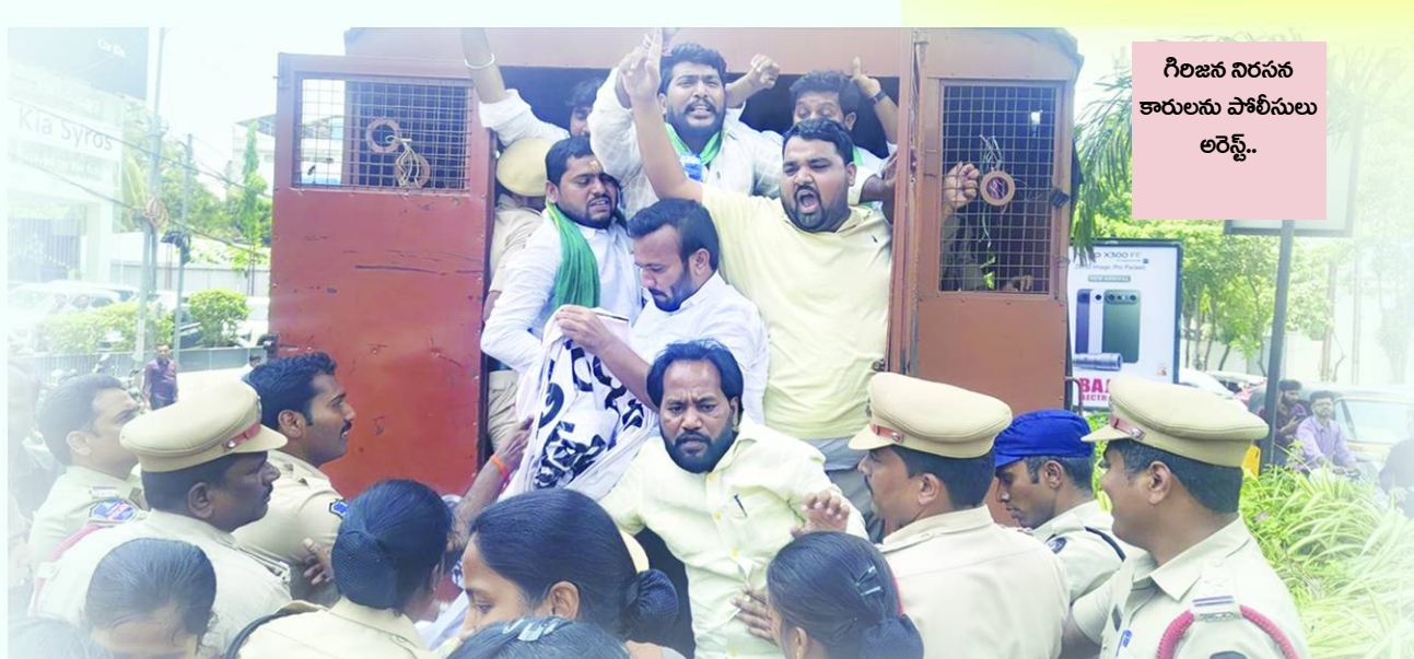
గిరిజన నిరసన కారులను పోలీసులు ఆరెస్ట్..