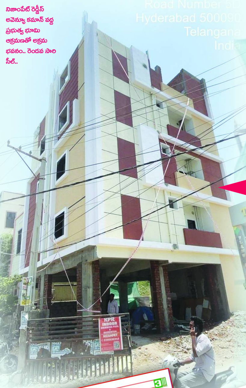
Road Number 5d, Hyderabad 500090, Telangana, India