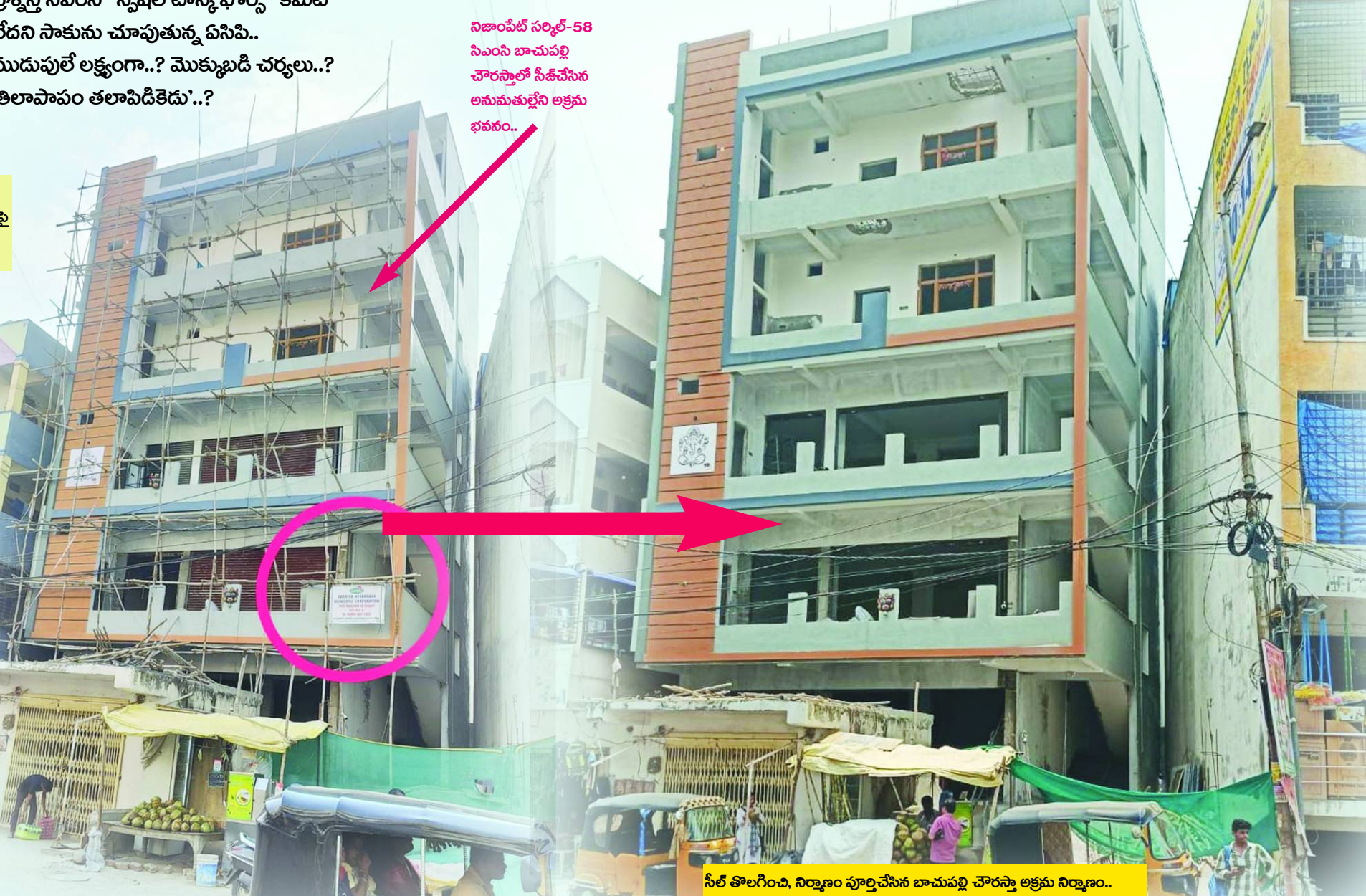
నిజాంపేట్ సర్కిల్-58 సిఎంసి బాచుపల్లి చౌరస్తాలో సీజ్ చేసిన అనుమతుల్లేని అక్రమ భవనం..