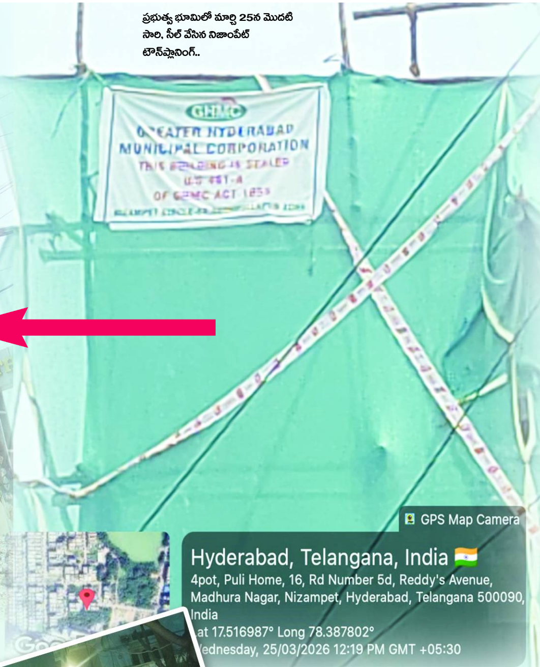
GPS Map Camera