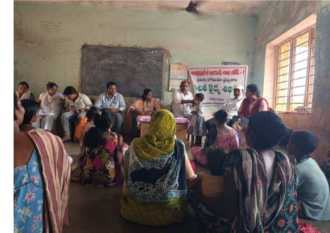
గూడెం కొత్తపేట, పెన్ పవర్, మే 21: జీతే వీధి మండలం దుప్పలవాడ గ్రామ సచివాలయ పరిధిలోని వలసగెడ్డ గ్రామంలో 'పీఎం జనభాగీదారి