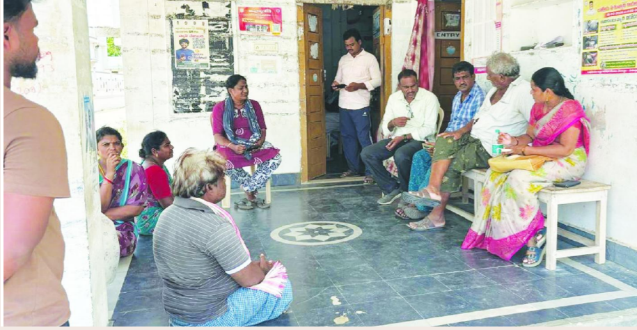
జరుగుమల్లి, మే 21, పెన్ పవర్.

కలెక్టర్ ఆదేశాలతో పాలేటిపాడు సచివాలయం లో విచారణ చేపట్టిన అధికారులు.