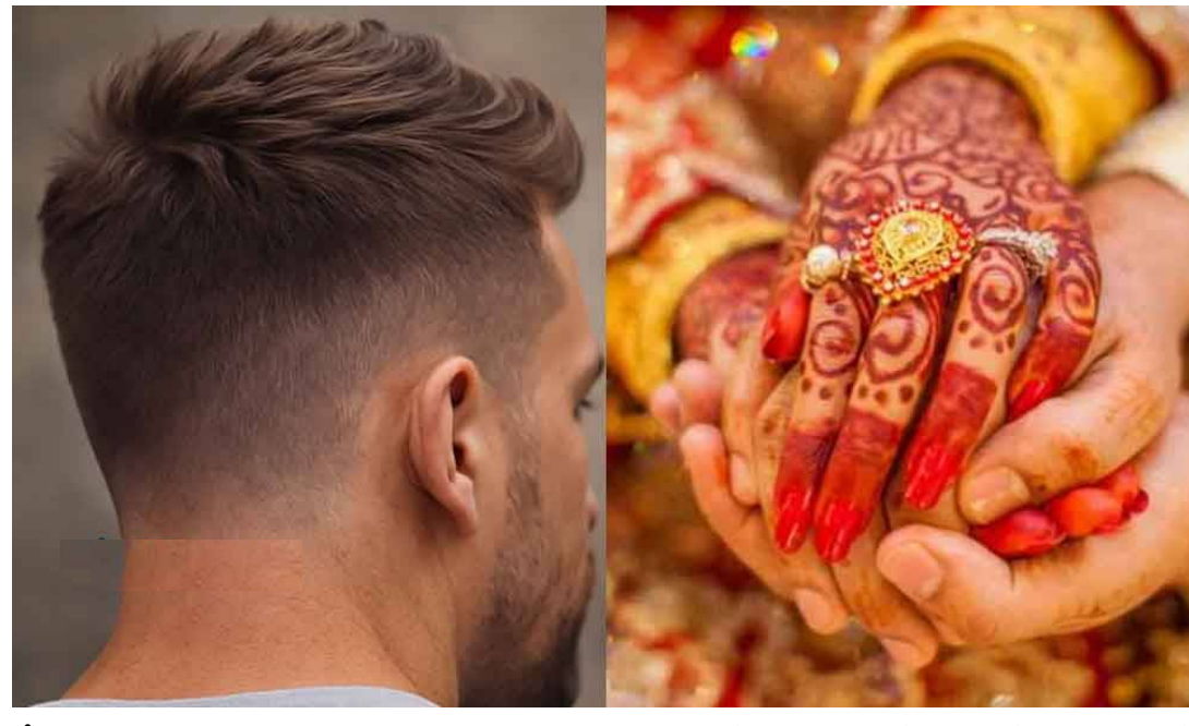
ట్రీట్ మెంట్ల చుట్టూ తిరగాల్సిన పరిస్థితి వస్తోంది.

లక్షల్లో జీతం, కోట్లలో ఆస్తి, విదేశాల్లో స్థిరపడటం... ఒకప్పుడు పెళ్లి సంబంధం కుదరాలంటే ఇవే మెయిన్ క్యాండ్లికేషన్స్. కానీ, ఇప్పుడు ట్రెండ్ రివర్స్ అయింది! 'రూపం కంటే గుణం ముఖ్యం' అనే సామెతను వక్రీకృతం చేశారు. 'కోట్ల జీతం కంటే, తలపై జుట్టే ముఖ్యమని యువత తగిన చెబుతోంది. పెళ్లిళ్లలో వైరల్ అవుతున్న ఈ ట్రెండ్, యువత మైండ్ సెట్ మార్పు గురించి మనము తెలుసుకుందాం.. జీతం కాదు... లుక్స్ మేటర్: ఈ రోజుల్లో పెళ్లి సంబంధాల మార్కెట్ పూర్తిగా మారిపోయింది. అబ్బాయికి ఎంత పెద్ద ఉద్యోగం ఉన్నా, బ్యాంక్ బ్యాలెన్స్ కోట్లలో ఉన్నా సరే... చూడటానికి స్ట్రాగ్గా లేకపోతే అమ్మాయిలు రిజెక్ట్ చేస్తున్నారు. ముఖ్యంగా బట్టలను ఉన్న అబ్బాయిలను పెళ్లి చేసుకోవడానికి చాలా మంది ఆసక్తి చూపించడం లేదని మ్యాచ్ మేకర్లు చెబుతున్నారు. యువతకు పెళ్లంటే ఒక యుద్ధం: ఒకప్పుడు చదువు, ఉద్యోగం వస్తే పెళ్లి అయిపోతుందనే ధీమా ఉండేది. కానీ ఇప్పుడు పెళ్లి చేసుకోవడం ఒక పెద్ద యుద్ధంలా మారింది. ఇక సరైన సంబంధం దొరకడానికి ఏళ్లు పడుతోంది. "పెళ్లి అవుతుందా? లేదా?" అనే టెన్షన్, ఆలోచనలతోనే యువతకు సగం వయసు అయిపోతోందని కొన్ని సర్వేలు చెబుతున్నాయి. అబ్బాయిల్లో పెరిగిన అభిప్రాయభావం: జీవితంలో ఎంతో కష్టపడి, మంచి పొజిషన్ కు రీచ్ అయినా... కేవలం లుక్స్ బాలిష్ చేసే కారణంతో రిజెక్ట్ అవుతుంటే దురదృష్టవశాత్తూ అబ్బాయిల్లో అభిప్రాయభావం పెరిగిపోతోంది. ఇక కెరీర్ పక్కన పెట్టి మరి హెయిర్ స్టైలింగ్, బ్యూటీ