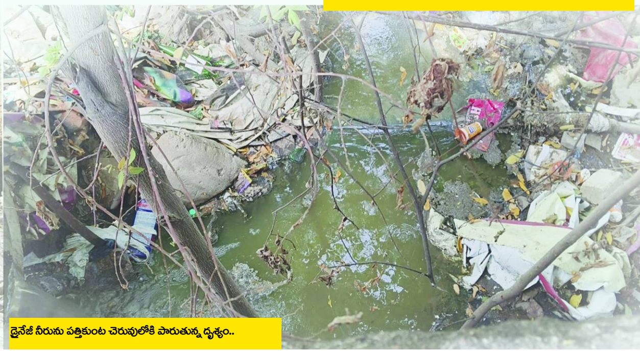
డ్రైనేజీ నీరును పత్తికుంట చెరువులోకి పారుతున్న దృశ్యం..