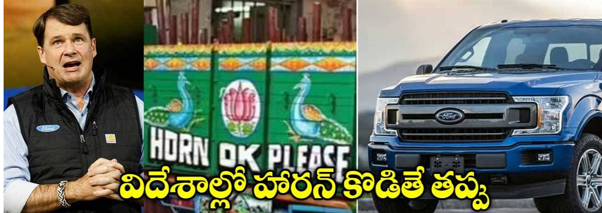
విదేశాల్లో హారన్ కొడితే తప్పు

ప్రపంచంలోని కార్ల మార్కెట్లలో భారతదేశం చాలా విభిన్నం అని ఫోర్డ్ కంపెనీ సీఈఓ జిమ్ ఫార్డ్ అన్నారు. ముఖ్యంగా ఇక్కడ డ్రైవర్లు హారన్లను వాడే విధానం, వాటికి ఉండే డిమాండ్ గురించి ఆయన ఆసక్తికర వ్యాఖ్యలు చేశారు. సోషల్ మీడియాలో ఫేర్ చేసిన ఒక చిన్న వీడియోలో.. ప్రపంచంలోనే అత్యంత గట్టిగా, ఎక్కువ కాలం మన్నే హారన్ల ఇండియాలోనే అవసరమవుతాయని ఆయన చెప్పారు. ఎక్కువ కాలం మన్నేలా.. గట్టిగా మోగేలా.. వీడియోలో ఫోర్డ్ ఒక ప్రశ్న అడుగుతూ మాట్లాడారు... "ప్రపంచంలో ఏ దేశానికి అత్యంత గట్టి హారన్ డిజైన్ అవసరం..?" కొన్ని దేశాల్లో హారన్లను కేవలం ప్రమాదాలు జరగకుండా చూసుకోవడానికి, ఎప్పుడో ఒకసారి మాత్రమే వాడతారని ఆయన చెప్పారు. కానీ ఇండియాలో మాత్రం పరిస్థితి వేరు. ఇక్కడి హారన్లు చాలా బలంగా ఉండాలి, ఎక్కువ కాలం పాడవకుండా పని చేయాలి, అలాగే వేరే దేశాల కంటే చాలా ఎక్కువగా మోగాల్సి ఉంటుంది. అందుకే ఈ ప్రశ్నకు సమాధానం "ఇండియా" అని ఆయనే చెప్పారు.