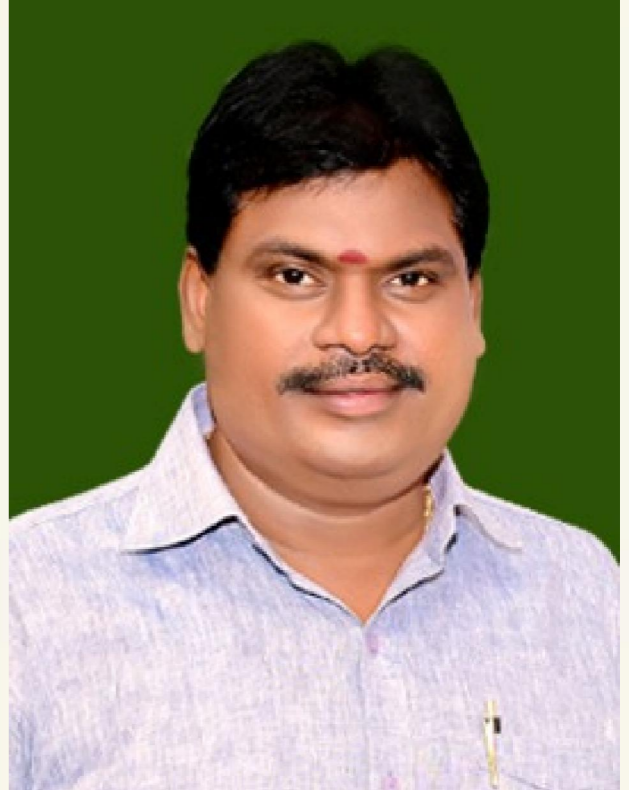
చూర్యవర్తి పెన్ పవర్ మే 25