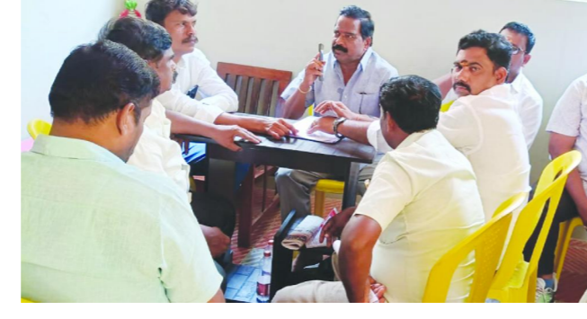
గిద్దలూరు పెన్ పవర్ మే 25

మహానాడు-2026 విజయవంతానికి గిద్దలూరు నియోజకవర్గంలో విస్తృత సన్నాహక సమావేశం సోమవారం నిర్వహించారు. తెలుగుదేశం పార్టీ అత్యంత ప్రతిష్టాత్మకంగా నిర్వహించనున్న "మహానాడు-2026" కార్యక్రమాన్ని ఈ నెల 27, 28 తేదీలలో గిద్దలూరు నియోజకవర్గంలోని తిరుమల కన్వెన్షన్ హాల్ లో విజయవంతంగా నిర్వహించాలనే లక్ష్యంతో నియోజకవర్గ ముఖ్య నాయకులతో విస్తృత స్థాయి సన్నాహక సమావేశం నిర్వహించారు. ఈ సందర్భంగా గిద్దలూరు నియోజకవర్గ తెలుగుదేశం పార్టీ నాయకులు, మండల అధ్యక్షులు, క్లస్టర్ ఇన్చార్జీలు ముఖ్య కార్యకర్తలు కలిసి మహానాడు నిర్వహణకు సంబంధించిన ఏర్పాట్లను సమగ్రంగా చర్చించారు. మహానాడును ఈసారి ఆధునిక సాంకేతిక