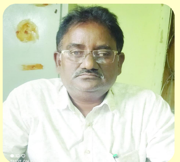
కొమరోలు పెన్ పవర్ మే 25