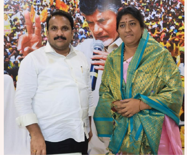
కందుకూరు పెన్ పవర్, మే 25