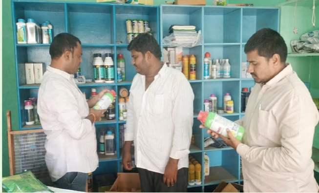
కొనకనమిట్ల పెన్ పవర్ మే 25