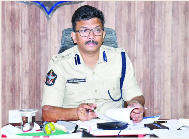
క్రైమ్ రిపోర్టర్ పెన్ పవర్, ఒంగోలు మే 25

- ప్రకాశం, మార్కాపురం జిల్లాల పోలీసు అధికారులతో జిల్లా ఎస్పీ నేర సమీక్షా సమావేశం