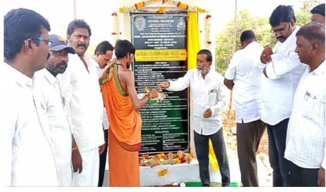
కొమరోలు పెన్ పవర్ మే 25

విజివల్ గా ప్రారంభించిన ముఖ్యమంత్రి చంద్రబాబు నాయుడు