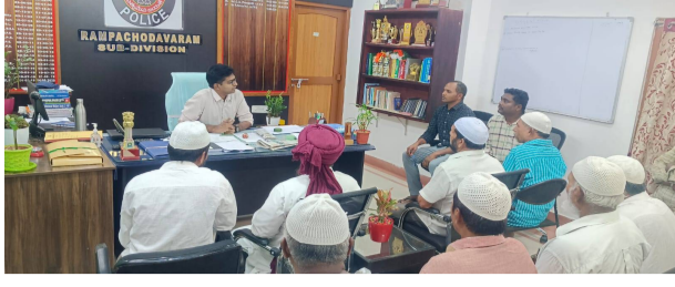
మున్సిం పెద్దలతో శాంతి కమిటీ సమావేశం గంగవరం /రంపచోడవరం, పెన్ పవర్ మే 25 :రానున్న బిక్రీడ్ పండుగను శాంతియుత వాతావరణంలో, పరస్పర సహకారంతో జరుపుకోవాలని రంపచోడవరం ఎస్టీపీవో అప్డేట్ అలీ

పిలుపునిచ్చారు.బిక్రీడ్ పండుగ ఏర్పాట్ల నేపథ్యంలో సోమవారం రంపచోడవరంలో మున్సిం మత పెద్దలు, స్థానిక ప్రముఖులతో శాంతి కమిటీ సమావేశం నిర్వహించారు. ఈ సందర్భంగా ఎస్టీపీవో మాట్లాడుతూ పండుగ సమయంలో ఎలాంటి అవాంఛనీయ ఘటనలు చోటుచేసుకోకుండా అందరూ పోలీసు శాఖకు సహకరించాలని కోరారు.ప్రజలు సామరస్య వాతావరణాన్ని కాపాడుతూ పండుగను ప్రశాంతంగా నిర్వహించుకోవాలని సూచించారు. పండుగ సందర్భంగా ట్రాఫిక్, భద్రత, ప్రాధాన్యత కార్యక్రమాల నిర్వహణపై పోలీసు శాఖ ప్రత్యేక చర్యలు చేపడుతుందని తెలిపారు.మున్సిం పెద్దలు కూడా పోలీసు శాఖ సూచనలను పాటిస్తూ శాంతి భద్రతల పరిరక్షణకు పూర్తి సహకారం అందిస్తామని తెలిపారు. సమావేశంలో పోలీసు అధికారులు, మున్సిం మత పెద్దలు, స్థానిక ప్రజాప్రతినిధులు పాల్గొన్నారు.