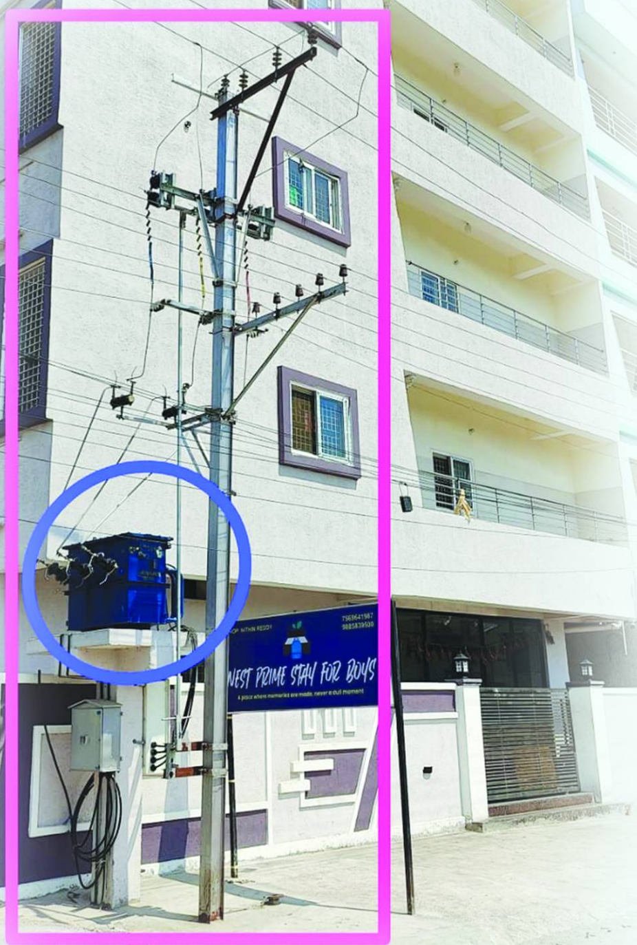
నిబంధనలు ఉల్లంఘించిన, ఓసి లేకపోయినా విద్యుత్ ట్రాన్స్ ఫార్మర్ మంజూరు..