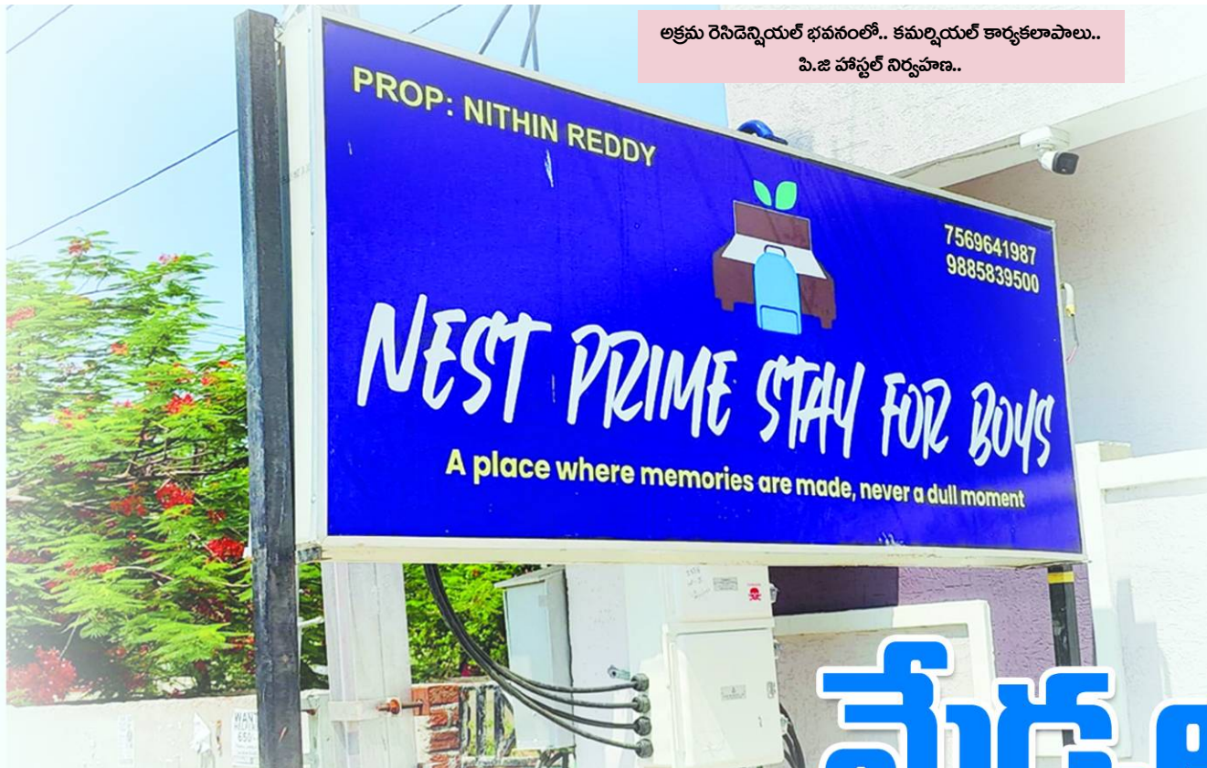
అక్రమ రెసిడెన్షియల్ భవనంలో.. కమర్షియల్ కార్యకలాపాలు.. పి.జి హాస్టల్ నిర్వహణ..