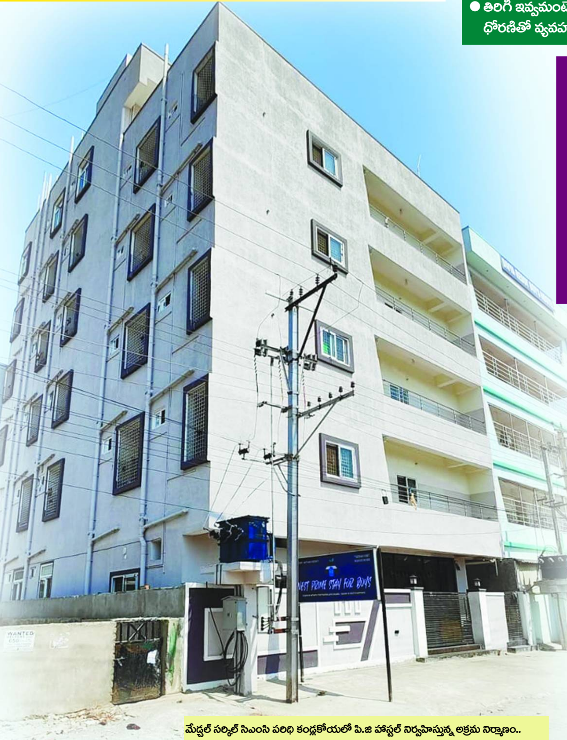
మేడ్చల్ సర్కిల్ నివాస పరిధి కండ్లకోయలో పి.జి హాస్టల్ నిర్వహిస్తున్న అక్రమ నిర్మాణం..