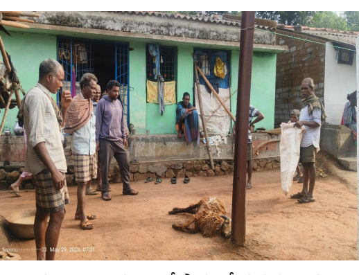
గొర్రెలు మృతి చెందాయి. అదే స్థానంలో మనుషులు మృతిచెంది ఉంటే, వెలకట్టలేమని దానికి బాధ్యతలు ముమ్మాటికి అధికారులేనని గ్రామ ప్రజలు వాపోయారు

హుకుంపేట పేన్ పవర్ మే 29 అల్లూరి సీతారామరాజు జిల్లా హుకుంపేట మండలం లో, గల భీమవరం పంచాయతీ, గంగ రాజ పుట్టు గ్రామం లో విద్యుత్ లైన్ ఎర్ల కావడం తో జన్మి రమ్మే కు సంబంధించిన 3 గొర్రెలు షాక్ తో మృతి చెందాయి. ఎన్.ఎస్.సార్వ విద్యుత్ శాఖ అధికారుల కు విద్యుత్ లైన్ సరి చేయాలనీ, లేదా మార్గాలను కోరిన సమస్య పరిష్కారం చేయలేదని గంగరాజు పుట్టు గ్రామస్థులు తెలిపారు. గొర్రెలు కాకుండా మనుషులకు షాక్ తగిలి ఉంటే, తీవ్ర ప్రాణ నష్టం జరిగేదని ఆవేదన వ్యక్తం చేశారు. ఇకవైనా విద్యుత్ లైన్ మరమ్మత్తులు చేపట్టాలని లేదా మార్గాలను ప్రజలు కోరుతున్నారని, మూడు గొర్రెలు చనిపోవడంతో రమ్మే కు దాదాపు 40 వేల రూపాయలు నష్టపోయానని దీనికి కారణం పూర్తిగా అధికారులేనని అధికారులు నిర్లక్ష్యమే నేడు