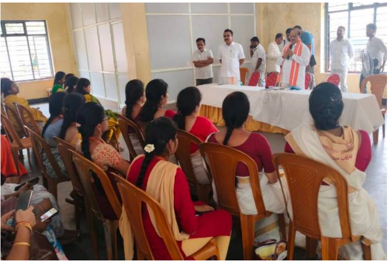
డిజిటల్ సేవలను విస్తృతంగా అమలు చేస్తున్నామని తెలిపారు. భక్తులు ముందస్తుగా సేవలు మరియు దర్శన టిక్కెట్లు బుక్ చేసుకునే విధానాన్ని మరింత సులభతరం చేశామని పేర్కొన్నారు. శిక్షణ పొందిన స్వచ్ఛంద సేవా సంస్థల ప్రతినిధులు ఇకపై అలయానికి వచ్చే సామాన్య భక్తులకు డిజిటల్ సేవలపై ప్రత్యక్షంగా సహాయం

సింహాచలం, పేన్ పవర్, మే 27 : భక్తులకు వేగవంతమైన, పారదర్శకమైన మరియు ఇబ్బందులేని సేవలు అందించాలనే లక్ష్యంతో శ్రీ వరహ లక్ష్మీనరసింహస్వామి దేవస్థానం ఆధ్వర్యంలో బుధవారం ప్రత్యేక "అవగాహన మరియు శిక్షణా కార్యక్రమం (ఎవస్సైన్ ట్రైనింగ్ ప్రోగ్రాం)" నిర్వహించారు. ఈ కార్యక్రమంలో వివిధ స్వచ్ఛంద సేవా సంస్థల ప్రతినిధులు పాల్గొని డిజిటల్ సేవలపై శిక్షణ పొందారు. దేవస్థానం ఐటీ విభాగం ఆధ్వర్యంలో నిర్వహించిన ఈ సదస్సులో, అలయానికి వచ్చే భక్తులు పూజలు, ప్రత్యేక దర్శనాలు, సేవా టిక్కెట్లు వంటి వాటిని డిజిటల్ పద్ధతుల్లో ఎలా సులభంగా పొందవచ్చో సభ్యులకు సమగ్రంగా వివరించారు. ముఖ్యంగా మనమిత్ర యూఎస్ఐఆర్, ఆన్లైన్ బుకింగ్ విధానం, క్యూఆర్ కోడ్ స్కానింగ్ సౌకర్యం, కియాస్కో ముఖ్య వినియోగం వంటి అంశాలపై ప్రాక్టికల్ డెమోతో అవగాహన కల్పించారు. ఈ సందర్భంగా దేవస్థానం ఈవో జె. వెంకట్రావు మాట్లాడుతూ, రోజురోజుకూ పెరుగుతున్న భక్తుల రద్దీని దృష్టిలో ఉంచుకొని, క్యూ లైన్లలో ఇబ్బందులు తగ్గించేందుకు