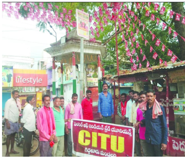
గిద్దలూరు పెన్ పవర్ మే 30