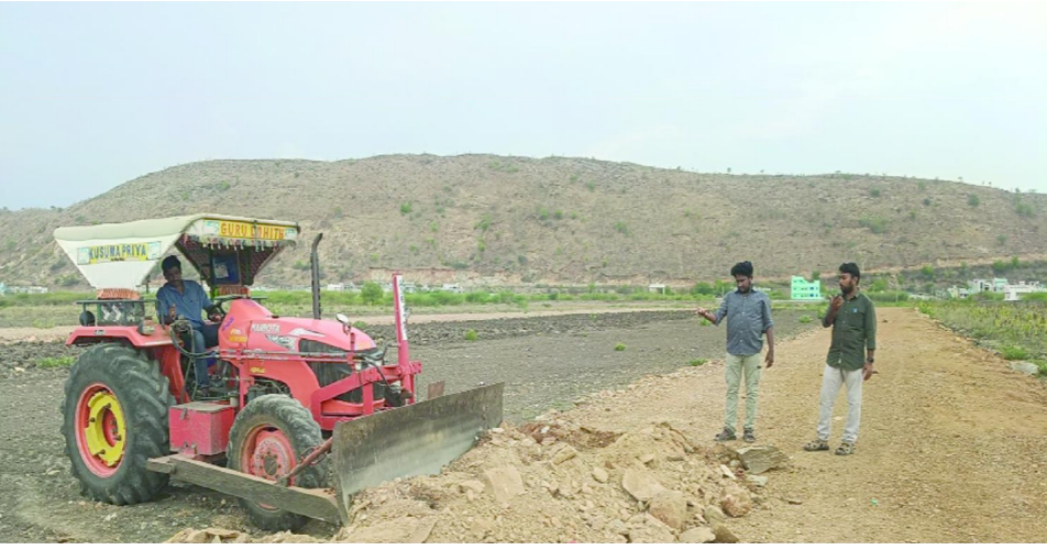
గిద్దలూరు పెన్ పవర్ మే 30

అక్రమ వెంచర్లపై పురపాలక అధికారులు రెండవరోజు కూడా చర్యలు చేపట్టి హద్దు రాజ్ ను అంతర్లత రోడ్డును తొలగిస్తున్నారు. గిద్దలూరు పురపాలక సంఘం పరిధిలో పట్టణ ప్రణాళిక విభాగం అధికారులు రెండవ రోజు కూడా అక్రమ లే అవుట్లపై కఠిన చర్యలు చేపట్టారు. ఎలాంటి అనుమతులు లేకుండా వెంచర్లు ఏర్పాటు చేస్తున్న నిర్వాహకులపై నిఘా మరింత కట్టుదిట్టం చేశారు. కొంతమంది రియల్ ఎస్టేట్ నిర్వాహకులు సంబంధిత శాఖల అనుమతులు లేకుండానే షాట్ల వేసి విక్రయస్తూ సామాన్య ప్రజలకు అరచేతిలో వెంచరం చూపిస్తున్నారని అధికారులు తెలిపారు. ఇటువంటి వెంచర్లలో పెట్టుబడులు పెట్టి ప్రజలు ఆర్థికంగా నష్టపోయే ప్రమాదం ఉందని హెచ్చరించారు. ప్రజలు షాట్లు కొనుగోలు చేసే ముందు లే అవుట్లకు సంబంధిత శాఖల నుంచి అనుమతులు ఉన్నాయా లేదా, ఆమోద పత్రాలు వెల్లుబాటు అవుతున్నాయా అనే విషయాలను తప్పనిసరిగా పరిశీలించాలని సూచించారు. అనుమతులు లేని లే అవుట్లలో షాట్లు కొనుగోలు చేసి మోసపోవద్దని అధికారులు ప్రజలకు