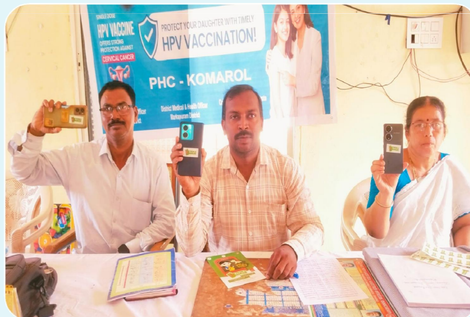
కొమరోలు పెన్ పవర్ మే 30