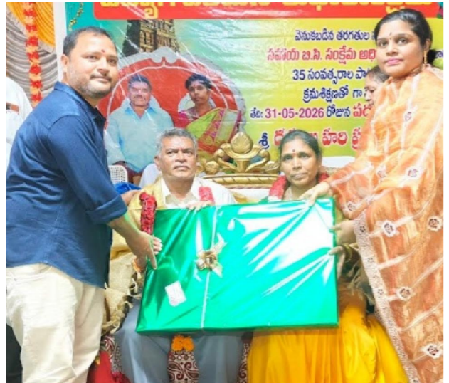
గిద్దలూరు పెన్ పవర్ మే 31