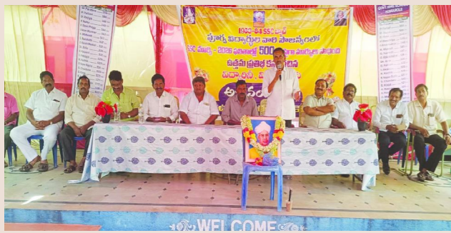
కొమరోలు పెన్ పవర్ మే 31

కొమరోలు లోని ప్రభుత్వ హైస్కూల్లో పూర్వ విద్యార్థుల సౌజన్యంతో ఘనంగా నిర్వహించిన సన్మాన కార్యక్రమాలు.