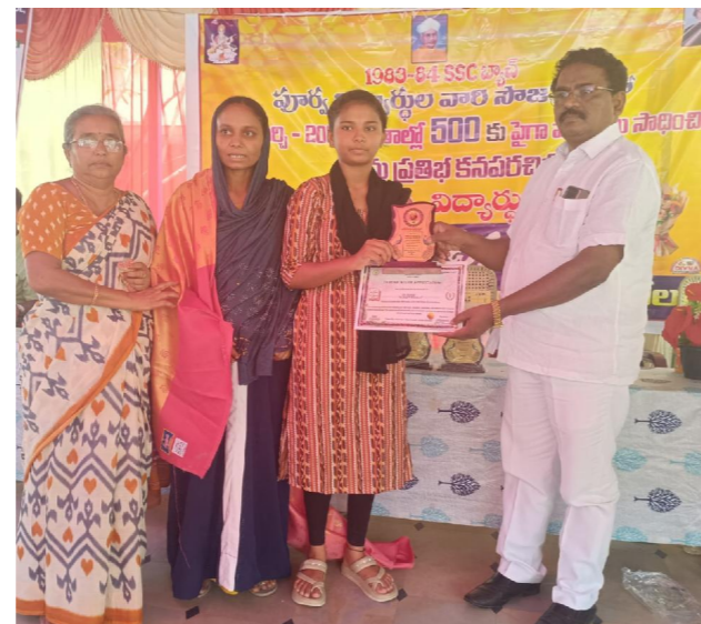
కొమరోలు పెన్ పవర్ మే 31.