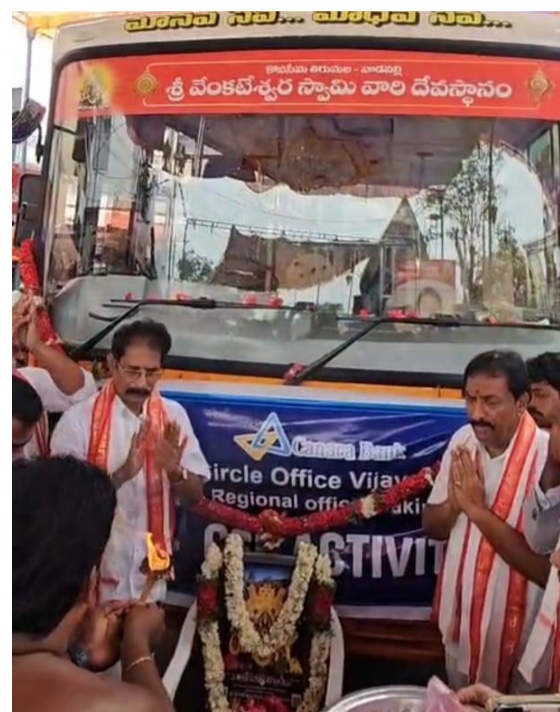
ప్రముఖ ఆధ్యాత్మిక కేంద్రంగా తీర్చిదిద్దుతున్నాయని స్థానికులు అభిప్రాయపడుతున్నారు.

నిర్వహించేందుకు పశ్చిమగోదావరి జిల్లా డ్రైన్ మిట్టి అసోసియేషన్, భారతీయ విద్యా భవన్ సంయుక్తంగా రూ.1.50 కోట్ల వ్యయంతో సెంట్రలైజ్డ్ కిచెన్, టేబుల్స్ తదితర సదుపాయాలను సమకూరుస్తున్నట్లు వెల్లడించారు. వాడపల్లి దేవస్థానం విస్తరణలో భాగంగా ఇప్పటికే శ్రీనివాసం-1 పనులు చేపట్టమని, శ్రీనివాసం-2 నిర్మాణానికి అవసరమైన నిధుల కోసం తిరుమల తిరుపతి దేవస్థానాలు సహకారం కోరుతున్నామని ఎమ్మెల్యే తెలిపారు. ఈ విషయాన్ని నారా చంద్రబాబు నాయుడు దృష్టికి తీసుకెళ్లగా సానుకూల స్పందన లభించిందని చెప్పారు. అనంతరం ఎమ్మెల్యే రూ.91.45 లక్షల వ్యయంతో చేపట్టిన పలు అభివృద్ధి పనులను ప్రారంభించారు. వీటిలో కేళంపాడనకాల వద్ద రూ.4.85 లక్షలతో నిర్మించిన తాత్కాలిక షెడ్, తాత్కాలిక అన్నదానశాల వద్ద రూ.10 లక్షలతో ఏర్పాటు చేసిన క్యూ లైన్ జీబ్ ఫ్రేములు, అర్బుక క్వార్టర్స్ వెనుక భాగంలో రూ.4.80 లక్షలతో నిర్మించిన సీటీ రోడ్డు, రూ.10 లక్షలతో నిర్మించిన ద్వీపక వాహనాల పార్కింగ్ షెడ్ ఉన్నాయి. అదేవిధంగా రూ.10 లక్షలతో రూ.50 ప్రత్యేక దర్శన క్యూ లైన్ వద్ద ఏర్పాటు చేసిన జీబ్ ఫ్రేములు, నర్సే నంబర్ 7/1 ఏలో షాపుల కోసం రూ.9.80 లక్షలతో నిర్మించిన జీబ్ షెడ్లను కూడా ప్రారంభించారు. ఈ పనులన్నీ భక్తులకు మెరుగైన సౌకర్యాలు కల్పించడంతో పాటు దేవస్థానం పరిస్థితుల అభివృద్ధికి దోహదపడతాయని అధికారులు తెలిపారు. భక్తుల అవసరాలను దృష్టిలో ఉంచుకుని ప్రభుత్వం, దేవస్థానం, దాతల కలిసి చేపడుతున్న అభివృద్ధి కార్యక్రమాలు వాడపల్లి క్షేత్రాన్ని రాష్ట్రంలోనే