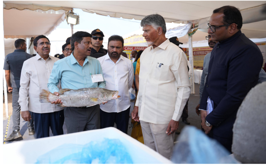
పేదల సేవలో కార్యక్రమంలో పాల్గొన్న ముఖ్యమంత్రికి జిల్లా ప్రజల తరపున కృతజ్ఞతలు