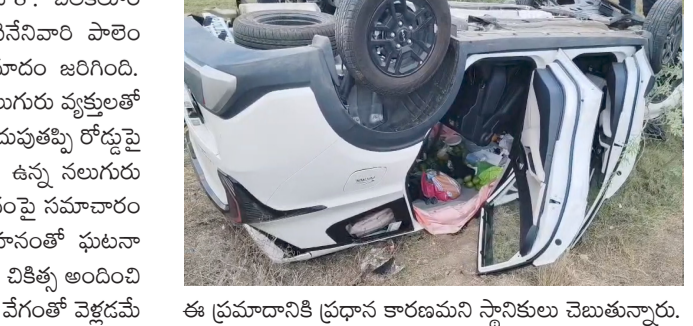
ఈ ప్రమాదానికి ప్రధాన కారణమని స్థానికులు చెబుతున్నారు.

చిలకలూరిపేట రూరల్, పెన్ పవర్, జూన్ 8 : చిలకలూరి పేట: మండలంలోని కావూరు, కోమలినీనెవారి పాలెం గ్రామాల మధ్య సోమవారం రోడ్డు ప్రమాదం జరిగింది. నరసరావుపేట నుంచి రాజమండ్రి వెళ్తు నలుగురు వ్యక్తులతో వెళ్తున్న ఒక కారు, అతివేగం కారణంగా అదుపుతప్పి రోడ్డుపై బోల్తా పడింది. ఈ ప్రమాదంలో కారులో ఉన్న నలుగురు వ్యక్తులకు తీవ్ర గాయాలయ్యాయి. ప్రమాదంపై సమాచారం అందుకున్న వెంటనే 108 సిబ్బంది వాహనంతో ఘటనా స్థలానికి చేరుకుని, క్షతగాతులకు ప్రాథమిక చికిత్స అందించి ఆసుపత్రికి తరలించారు. కారు మితిమీరిన వేగంతో వెళ్లడమే