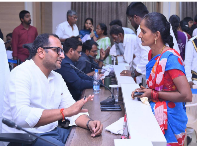
అర్జీని సకాలంలో పూర్తిగా పరిష్కరించాలని అధికారులను ఆదేశించారు. ఈ కార్యక్రమాల్లో అన్ని శాఖల జిల్లా స్థాయి అధికారులు, మండల తహశీల్దార్లు, సర్వే అధికారులు తదితరులు పాల్గొన్నారు.