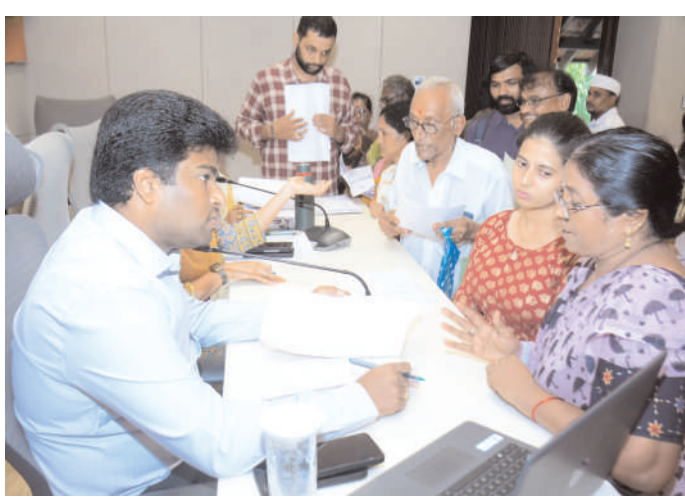
331 వినతులు అందాయి. వాటిలో రెవెన్యూ శాఖకు సంబంధించినవి 79 జీపీఎంసీకి సంబంధించినవి 96 పోలీసు శాఖకు సంబంధించినవి 25 ఇతర శాఖలకు సంబంధించినవి 31 ప్రజలు సమర్పించిన ప్రతి వినతిని నిర్దేశిత గడువులోగా పరిష్కరించి, బాధితులకు న్యాయం జరిగేలా చర్యలు తీసుకోవాలని కలెక్టర్ సంబంధిత అధికారులను ఆదేశించారు. ఈ కార్యక్రమంలో వివిధ శాఖలకు చెందిన అధికారులు పాల్గొన్నారు.