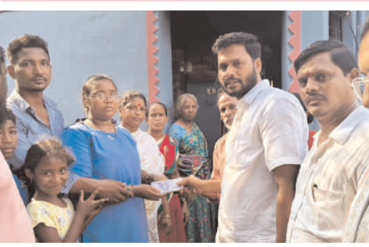
విశాఖ తూర్పు, పెన్ పవర్, జూన్ 8: విద్యుత్ షార్ట్ సర్క్యూట్ కారణంగా మంటలు చెలరేగి సర్పంచ్ కోల్పోయిన బాధితు కుటుంబానికి ఆపన్న హస్తం అందించిన 13వ వార్డు టిడిపి

విద్యుత్ షార్ట్ సర్క్యూట్ కారణంగా మంటలు చెలరేగి సర్పంచ్ కోల్పోయిన కుటుంబం