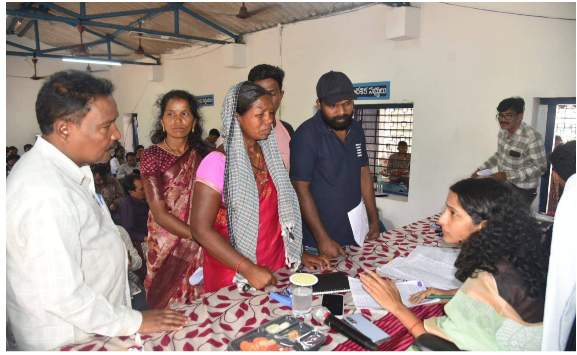
మండల స్థాయి సమస్యలు మండల పరిధిలో పరిష్కారం చేయాలని అధికారులకు జై, ఐటీడిపి పీజీ ఆదేశాలు జారీ. ప్రజలు ఇచ్చిన అర్జీలపై నిర్లక్ష్యంగా వ్యవహరిస్తే కఠిన చర్యలు తప్పవు.