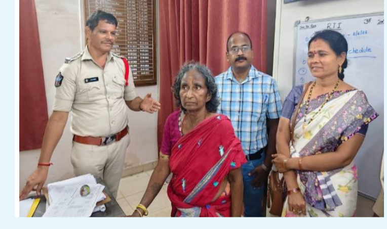
తప్పిపోయిన వృద్ధులారిని కుటుంబానికి చేర్చే పోలీసుల మానవతా సేవ. సత్కర స్పందనతో వృద్ధులారికి సహాయం చేసిన గోపాలపట్నం సీబి