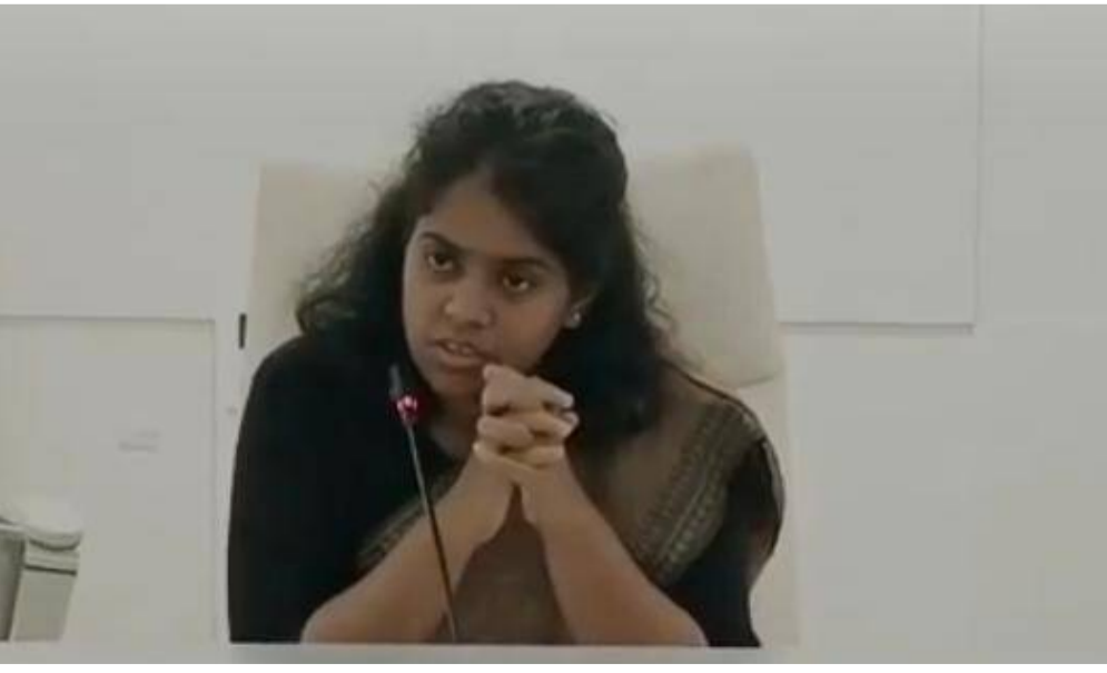
నిలిపే దిశగా చర్యలు చేపట్టాలని కలెక్టర్ కీర్తి అధికారులను ఆదేశించారు.

కార్యక్రమాలను నిరంతరం నిర్వహిస్తూ ప్రజల్లో అవగాహన కల్పించాలని సూచించారు. గ్రామాభివృద్ధి కార్యక్రమంలో అన్ని శాఖలు సమన్వయంతో పనిచేయాలని, ప్రతి శాఖ తన పరిధిలోని పనులకు సంబంధించిన కార్యాచరణ ప్రణాళికను రూపొందించి త్వరితగతిన అమలు చేయాలని కలెక్టర్ స్పష్టం చేశారు. మునికూడలిని గ్రామీణ పర్యాటక కేంద్రంగా అభివృద్ధి చేసే అవకాశాలను కూడా పరిశీలించాలని అధికారులకు సూచించారు. పుష్కరాల నాటికి గ్రామాన్ని ఆదర్శవంతమైన మోడల్ పుష్కర్ గ్రామంగా తీర్చిదిద్దే రాష్ట్రానికి, దేశానికి ఒక నమూనాగా