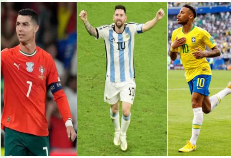
మిలిలిపోయింది. ఈ నేపథ్యంలో, 41 ఏళ్ల వయసులో బరిలోకి దిగుతున్న రొనాల్డోకు తన కలను నెరవేర్చుకోవడానికి ఇది చివరి అవకాశం. ప్రపంచకప్ చేదికపై అతను అదే ప్రతి మ్యాచ్ ఆఖరి కావచ్చనే భావనతోనే ఈ టోర్నీలో ఆడనున్నాడు.

హైదరాబాద్ పెన్ పవర్: ఫిఫా ప్రపంచకప్ 2026 ఈ అర్ధరాత్రి తర్వాత ప్రారంభం కానున్న నేపథ్యంలో, ప్రపంచవ్యాప్తంగా ఫుట్ బాల్ అభిమానుల్లో ఉత్సాహం పెరుగుతోంది. మరపురాని క్షణాలు, నాటకీయ ముగింపులతో అభిమానులను అలరించే ఈ మెగా టోర్నీమెంట్, ఈసారి ఒక శకానికి ముగింపు పలకనుంది. కొన్ని దశాబ్దాలుగా ఫుట్ బాల్ ప్రపంచాన్ని ఏలిన ఎందరో దిగ్గజ అటాకాకు ఇదే చివరి ప్రపంచకప్ కాబోతోంది. కోళ్ల మందికి స్ఫూర్తినిచ్చిన ఈ తరం మేటి క్రీడాకారుల కెరీర్ లో ఇది ఆఖరి అధ్యాయం కావచ్చు. వీరిలో కొందరు ఇప్పటికే ప్రపంచకప్ ట్రోఫీని ముద్దాడగా, మరికొందరు ఆ ఒక్క కల కోసం వివరిసారిగా పోరాడనున్నారు. ఈ నేపథ్యంలో, 2026 ప్రపంచకప్ తో తమ కెరీర్ కు ముగింపు పలకనున్న ఐదుగురు లెజెండ్ లో అటాకాల్లో ఓ ప్రత్యేక కథనం.