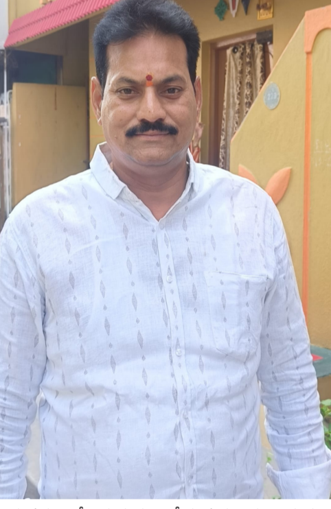
నాయకత్వంలో ప్రభుత్వం తీసుకున్న ఈ నిర్ణయం చారిత్రాత్మకమైనదని, ఈ నిర్ణయం ద్వారా బ్రాహ్మణులు, అర్థులు, వేద పండితులకు మరింత మెరుగైన సేవలు అందే అవకాశం కలుగుతుందని ఆశిస్తున్నామని తెలిపారు..