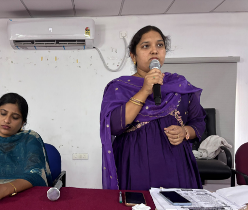
ఉంటే మూడు సార్లు సందర్శించే అవకాశం కల్పించబడుతుందని చెప్పారు. ముసాయిదా ఓటరు జాబితా జూలై 21న, తుది ఓటరు జాబితా సెప్టెంబర్ 22న ప్రకటించబడుతుందని వివరించారు. ఈ సమావేశంలో బీఎల్వోలు, బీఎల్ఎలు మరియు సంబంధిత అధికారులు పాల్గొన్నారు.