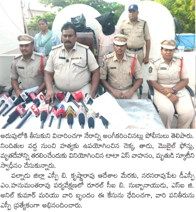
అదుపులోకి తీసుకుని విచారించగా నేరాన్ని అంగీకరించినట్లు పోలీసులు తెలిపారు.