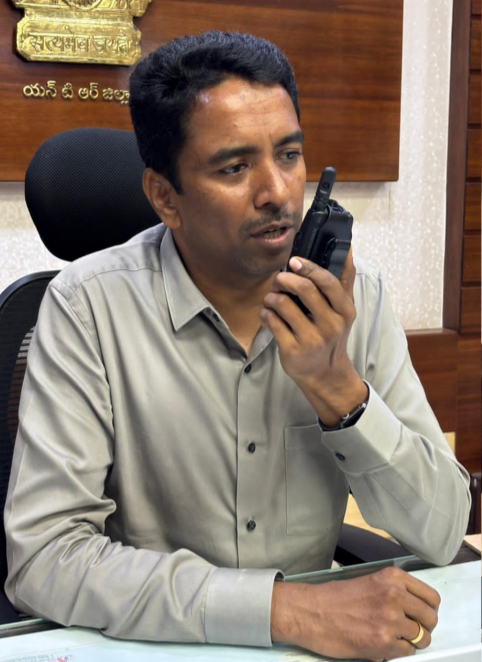
చర్యలు తీసుకుంటుందని కలెక్టర్ లక్ష్మీశ తెలిపారు. అకాల వర్షాలు, వడగళ్ల వానతో పంట నష్టపోయిన రైతులకు ప్రభుత్వం అండగా నిలుస్తుంది.. ప్రభుత్వ మార్గదర్శకాల ప్రకారం పంటలకు జరిగిన నష్టంపై రైతులకు పరిహారం అందుతుందని అందోళన చెందాల్సిన అవసరం లేదని కలెక్టర్ లక్ష్మీశ తెలిపారు..

విజయవాడ, పెన్ పవర్, జూన్, 11, ప్రస్తుతం వాతావరణ పరిస్థితుల నేపథ్యంలో జిల్లాలో అకాల వర్షాలు కురసిన అవకాశం ఉన్నందున అన్ని శాఖల అధికారులు అప్రమత్తంగా ఉండాలని జిల్లా కలెక్టర్ డా. జి. లక్ష్మీశ ఆదేశించారు. వాతావరణ, విపత్తుల నిర్వహణ శాఖ సూచనల మేరకు ముందస్తు జాగ్రత్త చర్యలు తీసుకోవాలని సూచించారు. విజయవాడ నగరపాలక సంస్థ, మున్సిపల్, పంచాయతీ శాఖలు డ్రైనేజీ వ్యవస్థల విషయంలో జాగ్రత్తగా ఉండాలని, ఎక్కడా నీరు నిల్వ కాకుండా చర్యలు తీసుకోవాలని ఆదేశించారు. వ్యవసాయ శాఖ అధికారులు రైతులకు తగిన సూచనలు ఇవ్వాలని, వంటలకు నష్టం కలగకుండా జాగ్రత్తలు తీసుకోవాలని తెలిపారు. ముఖ్యంగా మిర్చి రైతులను అప్రమత్తం చేయాలని కళ్లలోని మిర్చిని జాగ్రత్తగా భద్రపరచుకునేలా చేయాలని ఇవ్వాలని ఆదేశించారు. రెవెన్యూ, పోలీస్, విద్యుత్, ఆర్ అండ్ బీ డి.డి.ఆర్ శాఖలు అత్యవసర పరిస్థితుల్లో వెంటనే స్పందించేలా సిద్ధంగా ఉండాలని చెప్పారు. ప్రజలు వర్షాల సమయంలో చెట్ల కింద, విద్యుత్ స్తంభాల సమీపంలో నిలబడకూడదని, విన్నపిలు, వృద్ధులను జాగ్రత్తగా చూసుకోవాలని సూచించారు. ఎలాంటి అత్యవసర పరిస్థితులు ఎదురైనా స్థానిక అధికారులను వెంటనే సంప్రదించాలని కోరారు. అదేవిధంగా కలెక్టర్ కార్యాలయంలో కూడా కమాండ్ కంట్రోల్ కేంద్రం (91549 70454) అందుబాటులో ఉందని.. ఈ సెంటర్ కూడా ఫోన్ చేసి తెలియజేయవచ్చని కలెక్టర్ సూచించారు. జిల్లా యంత్రాంగం పూర్తిగా అప్రమత్తంగా ఉండి ప్రజల భద్రత కోసం అవసరమైన అన్ని