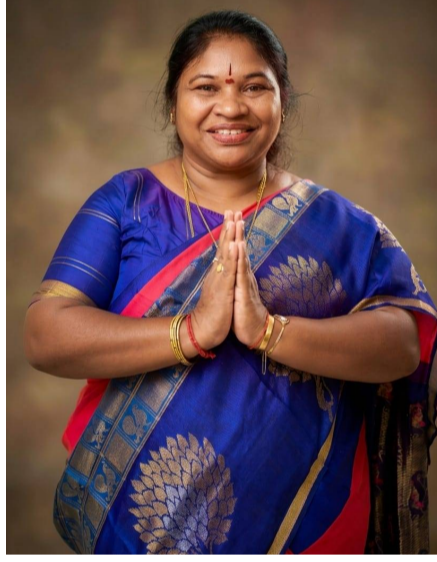
అధిక సంఖ్యలో పాల్గొనాలని నాయకులకు పిలుపు