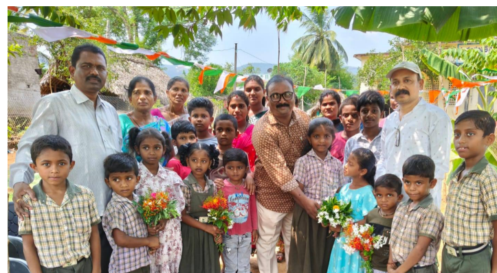
కొయ్యూరు, పెన్ పవర్ జూన్ 12: కొయ్యూరు మండలం బాలారం ఎంపీపీ పాఠశాలలో మన బడి మన పండుగ కార్యక్రమం ఎంతో అట్టహాసంగా ప్రారంభించారు. పాఠశాల ప్రధానోపాధ్యాయులు