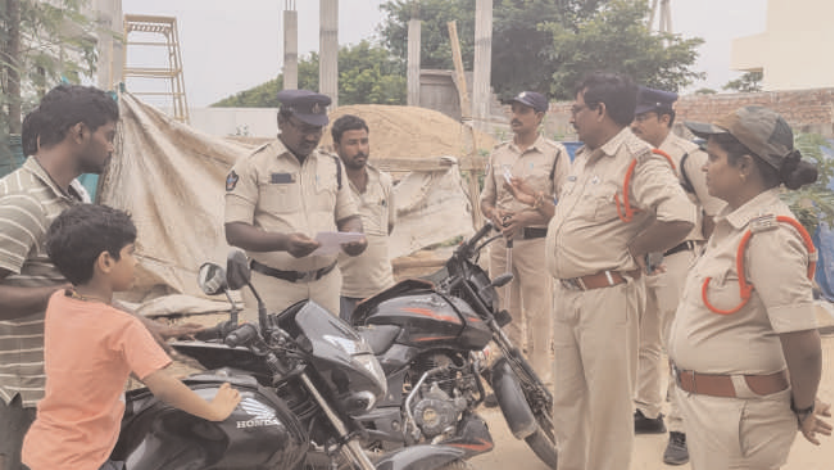
కార్లన్ అండ్ సెర్ట్ ఆపరేషన్లో 30 మోటార్ సైకిళ్లు సీజ్