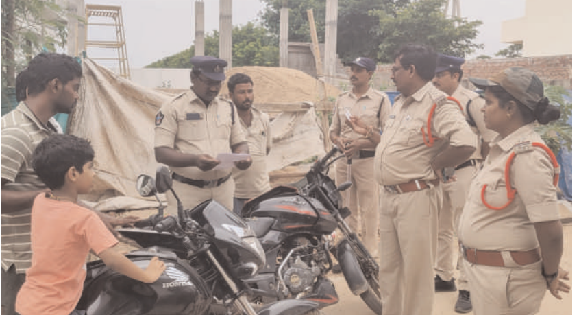
కార్గన్ అండ్ సర్టి ఆపరేషన్లో 30 మోటార్ సైకిళ్లు సీజ్