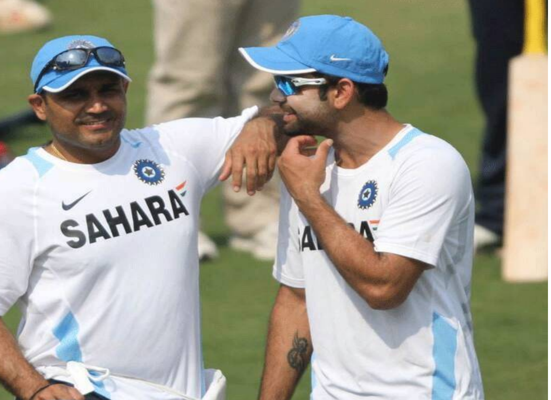
న్యూఢిల్లీ: క్రూడాాయిల్ ధరలు 90 డాలర్ల దగ్గర మరకొన్న నెలల పాటు ఉన్నా భారత ఆర్థిక వ్యవస్థ తట్టుకోగలదని పైనాన్నియల్ సర్వీసెస్ కంపెనీ అవెండస్ వెల్ట్ తన రిపోర్ట్ లో పేర్కొంది. అయితే, చమురు ధరలు స్థిరంగా ఆ స్థాయిని దాటి పెరిగితే మాత్రం దేశ జీడీపీ వృద్ధి, ప్రవృత్తులపై ప్రతికూల ప్రభావం పడుతుందని హెచ్చరించింది.

హార్వ్యాజ్ జలసంధిపై ఆధారపడటం: భారతదేశం తన ముడి చమురు దిగుమతుల్లో 47శాతం, ఎల్సీజీలో 61శాతం, ఎల్ఎన్జీ దిగుమతుల్లో 29శాతం వాటాను హార్వ్యాజ్ జల సంధి మార్గం గుండానే పొందుతోంది. పశ్చిమాసియా సంక్షోభం కారణంగా ఈ మార్గానికి అంతరాయం కలిగితే భారత్ కు చమురు కొరత ఏర్పడుతుంది. కరోల్ అకౌంట్ లోటు: చమురు ధరలు ప్రతి 10 డాలర్లు పెరిగినప్పుడల్లా, భారతదేశ కరోల్ అకౌంట్ లోటు దాదాపు 18 బిలియన్ డాలర్లు (రూ. 1.73 లక్షల కోట్లు) పెరుగుతుంది. ఇది దేశ జీడీపీలో 0.41 శాతానికి సమానం. జీడీపీ వృద్ధిపై ప్రభావం: బ్రెంట్ క్రూడ్ ధర ప్రతి 10 డాలర్లు పెరిగితే, అది భారత జీడీపీ వృద్ధి రేటును 30 నుంచి 35 బేసిస్ పాయింట్లు (0.30శాతం --- 0.35శాతం) మేర దెబ్బతీస్తుంది. చమురు ధరలు ఎక్కువ కాలం పాటు గరిష్ట స్థాయిల్లో కొనసాగితే, రిటైల్ ప్రవృత్తులు ఆర్బీఐ నిర్దేశించిన పరిమితిని దాటిపోయే ప్రమాదం ఉంది. ప్లస్ పాయింట్స్.. అవెండస్ రిపోర్ట్ ప్రకారం, ఇన్ని సవాళ్లు ఉన్నప్పటికీ, ప్రస్తుతం భారత ఆర్థిక వ్యవస్థ స్ట్రాంగ్ గా ఉంది. దేశ బ్యాంకింగ్ సెక్టార్ లో రూ. 5.1 లక్షల కోట్ల లిక్విడిటీ (మిగులు నిధులు) అందుబాటులో ఉండటం, 11 నెలల దిగుమతులకు సరిపడా ఫారెక్స్ ఉండటం కలిసొస్తుంది. కార్పొరేట్ కంపెనీల బ్యాలెన్స్ షీట్లు కూడా బలంగా ఉన్నాయి.