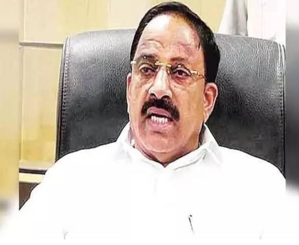
- మిగతా 5లో...

హైదరాబాద్ పెన్ పవర్: రాష్ట్రంలోని రైతులు వరి పంటపై ఆధారపడకుండా కందులు, పెనలు, మినుములు, జొన్నలు, సజ్జలు, మొక్కజొన్న, సువ్వులు, అముదం వంటి తక్కువ నీటితో సాగయ్యే పంటలను ప్రోత్సహించేలా ప్రత్యేక కార్యచరణ ప్రణాళికను సిద్ధం చేసినట్లు రాష్ట్ర వ్యవసాయ శాఖ మంత్రి తుమ్మల నాగేశ్వర రావు వెల్లడించారు. విత్తనాల కొరత తలెత్తకుండా ఈ ఖరీఫ్ సీజన్కు 87.49 లక్షల క్వింటాళ్ల విత్తనాలను అందుబాటులో ఉంచామని, కందులు, జొన్నలు, మొక్కజొన్న, సజ్జలు వంటి ప్రత్యామ్నాయ పంటల విత్తనాలను జిల్లాల్లో ముందుగానే నిల్వ చేసినట్లు తెలిపారు. ఆదివారం ఖరీఫ్ సీజన్ పై అధికారులతో సమీక్ష నిర్వహించారు. ఎల్సీఎస్ ప్రభావాన్ని ముందుగానే అంచనా వేసి ఏప్రిల్ నెలలోనే వ్యవసాయశాఖ అధికారులు, వ్యవసాయ విశ్వవిద్యాలయ శాస్త్రవేత్తలు, వాతావరణ శాఖ నిపుణులతో సమీక్ష నిర్వహించి ముందస్తు కార్యచరణ