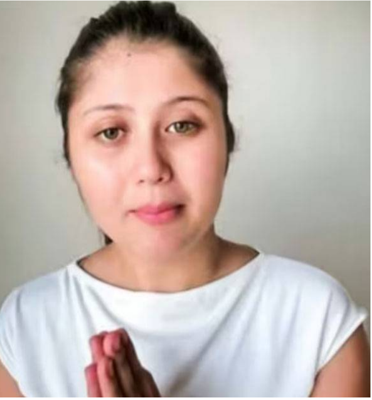
ఫ్లాట్ ఫారమ్లపై కంట్రోల్ క్రియేట్ చేయాలి, సెలబ్రిటీలు పాపాలారితీ కోసం వివాదాస్పద అంశాలను ఎంచుకోవడం కామన్ అయిపోయింది. అయితే భావప్రకటన స్వేచ్ఛ అనేది ఇతరుల హక్కులను, గౌరవాన్ని భంగపరచేలా ఉండకూడదనే వాదనలు బలంగా వినిపిస్తున్నాయి. ముఖ్యంగా రాత్రింబవళ్లు శ్రమించే వైద్య విద్యార్థుల మానసిక స్థితిని, వారి సామాజిక