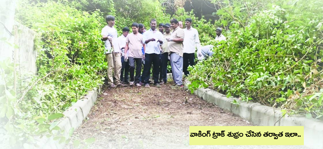
వాకింగ్ ట్రాక్ శుభం చేసిన తర్వాత ఇలా..