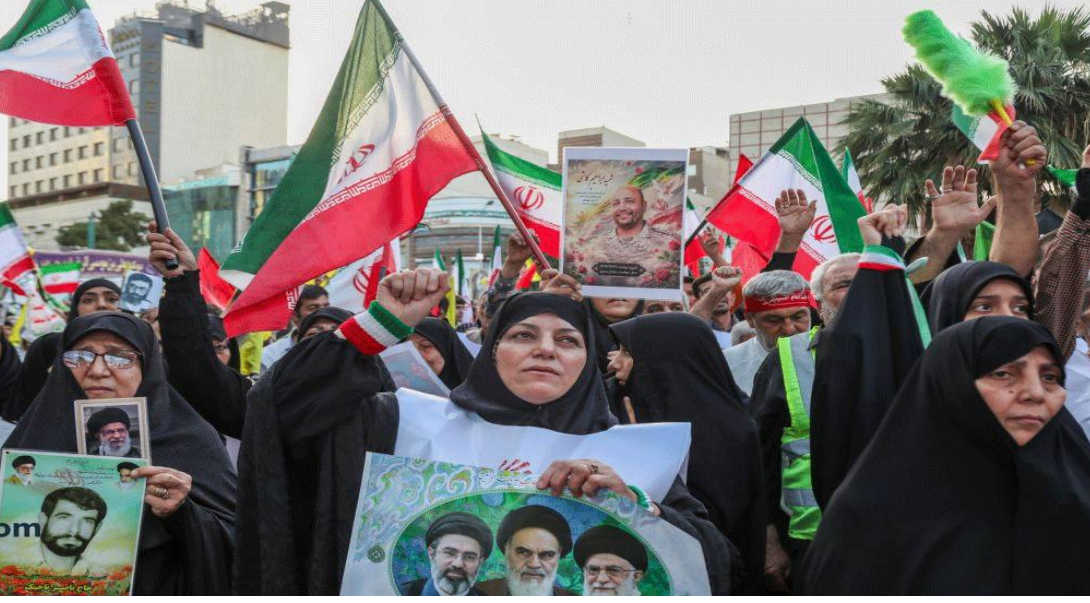
మధ్యప్రాచ్య ప్రాంతంలో మరోసారి రాజకీయ ఉద్రిక్తతలు పెరుగుతున్నాయి. అమెరికా ప్రతిపాదించిన శాంతి ఒప్పందం ఈ ఇరాన్ అంగీకరించినప్పుడు వార్షిక వెలుపడడంతో ఆ దేశంలో భారీ స్థాయిలో నిరసనలు చెలరేగాయి. వేలాది మంది ప్రజలు రాజధాని టెహ్రాన్ లో పాటు పలు ప్రధాన నగరాల్లో రోడ్లపైకి వచ్చి ప్రభుత్వానికి వ్యతిరేకంగా ఆందోళనలు చేపట్టారు. ఈ ఒప్పందం ఇరాన్ జాతీయ ప్రయోజనాలకు విరుద్ధమని, అమెరికా ఒత్తిడికి ప్రభుత్వం తోడ్పాడని నిరసనకారులు ఆరోపిస్తున్నారు.

కొన్ని నిబంధనలు ఇరాన్ అణు కార్యక్రమం, భద్రతా విధానాలపై ప్రభావం చూపే అవకాశం ఉందనే ఆందోళన ప్రజల్లో వ్యక్తమవుతోంది. ప్రభుత్వం ఈ ఒప్పందంపై పూర్తిస్థాయి వివరాలు వెల్లడించకపోవడంతో అనుమానాలు మరింత పెరిగాయి. ట్రాఫ్ట్ ఒప్పందానికి అధికారికంగా అంగీకరిస్తే దేశవ్యాప్తంగా మరింత పెద్ద ఎత్తున ఉద్యమాలు చేపడతామని నిరసనకారులు హెచ్చరిస్తున్నారు. ఆశ్చర్యకరమైన విషయం ఏమిటంటే ఈ డీల్ ను వ్యతిరేకిస్తూ ఇజ్రాయెల్ లోనూ నిరసనలు వ్యక్తమవుతున్నాయి. ఇరాన్ తో ఎలాంటి ఒప్పందమైనా తమ దేశ భద్రతకు ముప్పు కలిగించే అవకాశముందని ఇజ్రాయెల్ లోని పలు రాజకీయ, సామాజిక వర్గాలు ఆందోళన వ్యక్తం చేస్తున్నాయి. అమెరికా ఇరాన్ కు ఎక్కువ రాయితీలు ఇస్తోందని, ఇది ప్రాంతీయ భద్రతా సమీకరణాలను దెబ్బతీసే ప్రమాదం ఉందని వారు అంటున్నారు. ఇరాన్, ఇజ్రాయెల్ వంటి పరస్పర విరోధ దేశాల్లో ఒకే ఒప్పందంపై నిరసనలు చెలరేగడం అంతర్జాతీయ రాజకీయాల్లో అరుదైన పరిణామంగా విశ్లేషకులు పేర్కొంటున్నారు. ఒకవైపు అమెరికా మధ్యప్రాచ్యంలో శాంతి స్థాపనకు ప్రయత్నిస్తుండగా మరోవైపు ఈ ఒప్పందం రెండు దేశాల్లోనూ వ్యతిరేకతను ఎదుర్కొండం పరిస్థితిని మరింత సంక్లిష్టంగా మార్చింది. ప్రస్తుతం ఈ డీల్ డీల్ పై అధికారిక ప్రకటనలు, చర్చలు కొనసాగుతుండగా మధ్యప్రాచ్య దేశాలు, ప్రపంచ శక్తులు పరిస్థితిని నిశితంగా గమనిస్తున్నాయి. రాబోయే రోజుల్లో ఈ ఒప్పందం అమలుకు వస్తుందా? లేక ప్రజా వ్యతిరేకత కారణంగా నిలిచిపోతాదా? అన్నది అంతర్జాతీయ వేదికపై ఆసక్తికర చర్చగా మారింది.