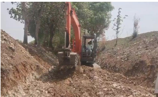
రైతులు స్థానిక ప్రజలు కృతజ్ఞతలు తెలియజేశారు.

గిద్దలూరు పెన్ పవర్ జూన్ 16 రైతుల సంతకములను లక్ష్యంగా గిద్దలూరు శాసనసభ్యులు ముత్తుముల ఆశోక్ రెడ్డి ముందు చూపుతో రాచర్ల మండలంలోని గుడిమెట్ల గ్రామ పంచాయతీ పరిధిలోని రైతాంగానికి మేలు చేకూర్చాలనే సంకల్పంతో గుడిమెట్ల లోని శంకరుని చెరువు సపై ఛానల్ పనులను వేగవంతంగా పూర్తి చేయాలని ఆధికారులను ఆదేశించారు. ఎమ్మెల్యే ఆదేశాలతో వెనువెంటనే రంగంలోకి దిగిన అధికారులు శంకరుని చెరువు సపై ఛానల్ మరమ్మత్తు పనులను యుద్ధప్రతిపదికన నిర్వహిస్తున్నారు. ఈ సపై ఛానల్ పనులు పూర్తి అయితే ఆయకట్టు కింద ఉన్నటువంటి 402.77 ఎకరాల వ్యవసాయ భూములకు రైతులకు ఎంతో మేలు కలగనుంది. తమ సాగునీటి కష్టాలను తీరుస్తూ, పంట పొలాలకు నీరందించేందుకు ప్రత్యేక చొరవ చూపిన ఎమ్మెల్యే కు ఆయకట్టు ప్రాంత