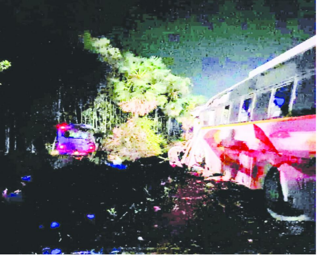
గుడ్లూరు, పెన్ పవర్, జూన్ 16