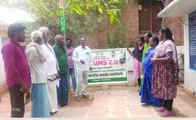
గుడ్లూరు, పెన్ పవర్, జూన్ 16

పచ్చికొట్ట ఎరువులకు 20లోపు రిజిస్ట్రేషన్ చేయించుకోవాలి