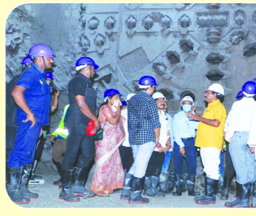
వార్ నిర్మించి పూర్తి చేయబోతున్నాం అని అన్నారు. టీగలేరు, ఈస్టర్న్ మెయిన్ కెనాల్స్ తో పాటు పర్మనెంట్ డ్రైవర్స్ రోడ్డు పనులు సైతం జూన్ నెలాఖరు నాటికి పూర్తికానున్నాయి అని, ముఖ్యమంత్రి చంద్రబాబు నాయుడు ఆదేశాల ప్రకారం, సీజన్ మొదలయ్యే నాటికి నల్లమలసాగర్ రిజర్వాయర్ నింపేలా పనులు జరుగుతున్నాయి అని తెలిపారు. వైసీపీ నాయకులు వెలిగొండ కు బడ్జెట్ లో