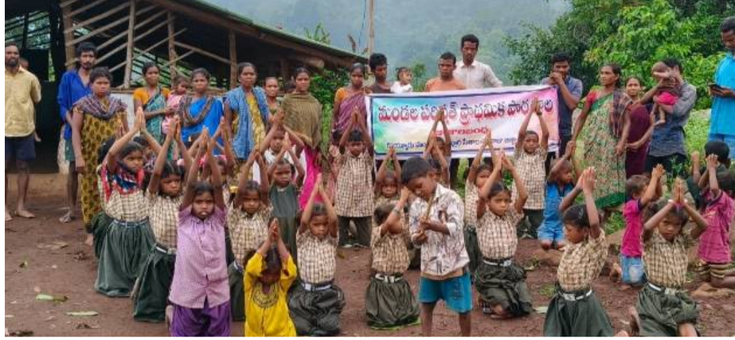
జాబల బంధ పివీటిజి విద్యార్థుల మొర...

కొయ్యూరు, పెన్ పవర్ జూన్ 18: మా గ్రామంలో పాఠశాల ఉండనేది పేరుకే అని ఏనాడు సక్రమంగా తెరవలేదని.. ఈ ఏడాది స్కూల్స్ తెరిచి ఐదు రోజులవుతున్నా నేటికీ టీచర్ రాలేదంటూ ఆ ఆదివాసీ విద్యార్థులు మొరపెడుతున్నారు. తమ పాఠశాల తీర్చిపంపి అంటూ జాబల బంధ లో ఉన్న 34 మంది అమాయక పిల్లలు కలెక్టర్ అమ్మా కు వేడుకున్నారు. అల్లూరి జిల్లా కొయ్యూరు మండలంలోని మూలపేట పంచాయతీకి చెందిన శివారు గ్రామమైన జాబల