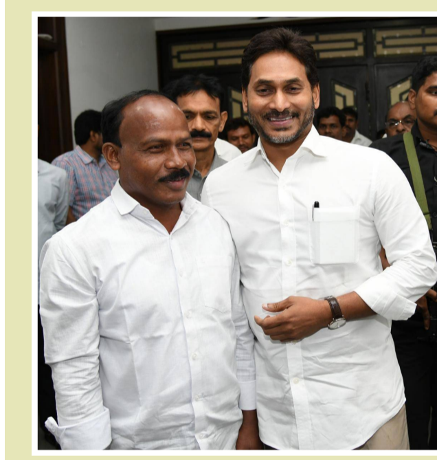
పార్టీ బలోపేతం, ముస్లింలలోని సమస్యలపై చర్చ జి.మాడుగుల. పెన్ పవర్, జూన్ 18) వైఎస్సార్ కాంగ్రెస్ పార్టీ అధ్యక్షులు, మాజీ ముఖ్యమంత్రి