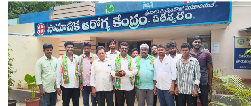
బీసీలకు రాజ్యాధికారంలో భాగస్వామ్యం బి సి వై పార్టీ పోరాటానికి మద్దతు ఇవ్వండి: శివకుమార్