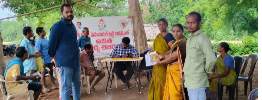
గిరిజన గ్రామాల ప్రజలకు ఉచిత వైద్య సేవలు, మందుల పంపిణీ