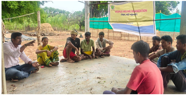
పంటల దిగుబడులు పెరుగుతాయని పేర్కొన్నారు. ఈ కార్యక్రమంలో పీపుల్స్ వెల్ఫేర్ ఆర్గనైజేషన్ సిబ్బంది, స్థానిక రైతులు, గ్రామ యువకులు పాల్గొని సీడ్ బాల్స్ తయారీ విధానంపై అవగాహన పొందారు.

చింతూరు, పెన్ పవర్, జూన్ 18: నర్సింగపేట గ్రామంలో పీపుల్స్ వెల్ఫేర్ ఆర్గనైజేషన్ ఆధ్వర్యంలో సీడ్ బాల్స్ పై అవగాహన కార్యక్రమం నిర్వహించారు. ఈ సందర్భంగా సంస్థ ప్రతినిధులు మాట్లాడుతూ, గ్రామాల్లోని ఖాళీ స్థలాల్లో సీడ్ బాల్స్ ను వేయడం ద్వారా పచ్చదనం పెంపొందించవచ్చని తెలిపారు. మట్టిలో విత్తనాలను ఉంచి చిన్న బంతులుగా తయారు చేసి ఖాళీ ప్రదేశాల్లో విసిరివేయడం వల్ల విత్తనాలు వీడవడం నుంచి రక్షణ పొంది సహజసిద్ధంగా మొక్కలుగా ఎదుగుతాయని వివరించారు. ప్రస్తుతం వాతావరణ మార్పులు మానవ జీవన విధానంపై ప్రతికూల ప్రభావం చూపుతున్న నేపథ్యంలో ప్రతి ఒక్కరూ మొక్కల పెంపకానికి ప్రాధాన్యత ఇవ్వాలని సూచించారు. విస్తృతంగా చెట్లను పెంచడం ద్వారా జీవ వైవిధ్యం అభివృద్ధి చెందడంతో పాటు వాతావరణ సమతుల్యత నెలకొని సకాలంలో వర్షాలు కురిసి