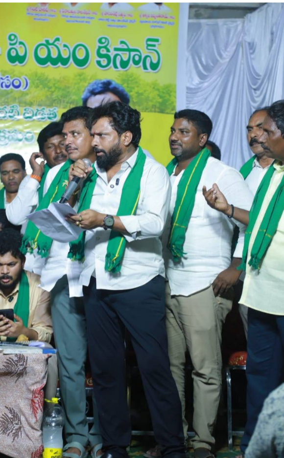
మహిళలకు రైతు ప్రతినిధులు, కూటమి నాయకులు తదితరులు పాల్గొన్నారు.