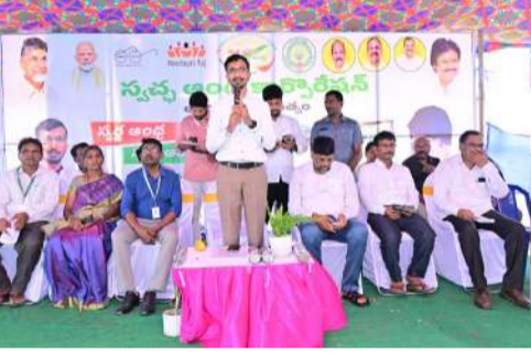
గ్రామాన్ని పరిశుభ్రంగా ఉంచడం ప్రతి ఒక్కరి బాధ్యత అని పేర్కొంటూ, ప్రభుత్వం చేపట్టిన స్వచ్ఛ ఆంధ్ర -- స్వచ్ఛాంధ్ర కార్యక్రమాన్ని విజయవంతం చేయాలని ప్రజలకు పిలుపునిచ్చారు. అనంతరం గ్రామంలో చేపడుతున్న పారిశుధ్య కార్యక్రమాలను పరిశీలించి, అధికారులు నిరంతరం పర్యవేక్షణ చేస్తట్టి గ్రామాలను పరిశుభ్రంగా ఉంచేలా చర్యలు తీసుకోవాలని ఆదేశించారు. కార్యక్రమంలో స్థానిక అధికారులు, ప్రజాప్రతినిధులు, గ్రామస్థులు పాల్గొన్నారు.